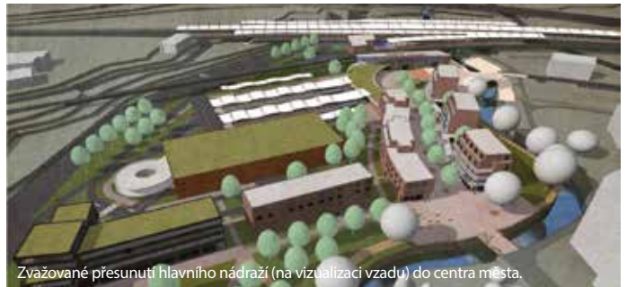
Vvažované přesunutí hlavního nádraží (na vizualizaci vzhodu) do centra města.

Přesunutí hlavního nádraží do centra města je další zajímavou myšlenkou územního plánu. Ten blokuje pozemky v území ohraničeném ulicemi Lipská a Bezručova, silnicí I/13 a nákladovou kolejí. V tomto prostoru, které bude podrobeno územní studii o reálnosti záměru, by mohlo v budoucnosti vzniknout hlavní vlakové nádraží, které by tak bylo přístupnější pro obyvatele. Jednou z variant je propojení autobusového a vlakového nádraží, čímž by vznikl dopravní terminál 21. století. Územní plán řeší i takto odvážné myšlenky, záleží pak ale na podmínkách realizace. Radnice už v této souvislosti komunikuje se Správou železniční dopravní cesty, která má v plánu opravovat současné