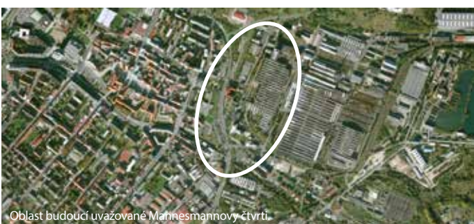
Oblast budoucí uvažované Mannesmannovy čtvrti.