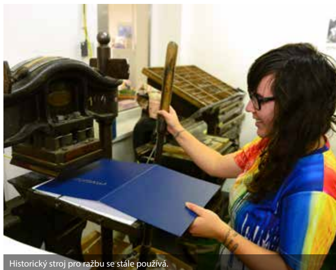
Historický stroj pro ražbu se stále používá.

Dalším skvostem je například dřevěný lis, více než sto let stará rýlovačka, šička či zlatička. Z mladší historie je maloofsetový tiskařský stroj ze šedesátých let, který ještě nyní tiskárna používá. Je však zmo-