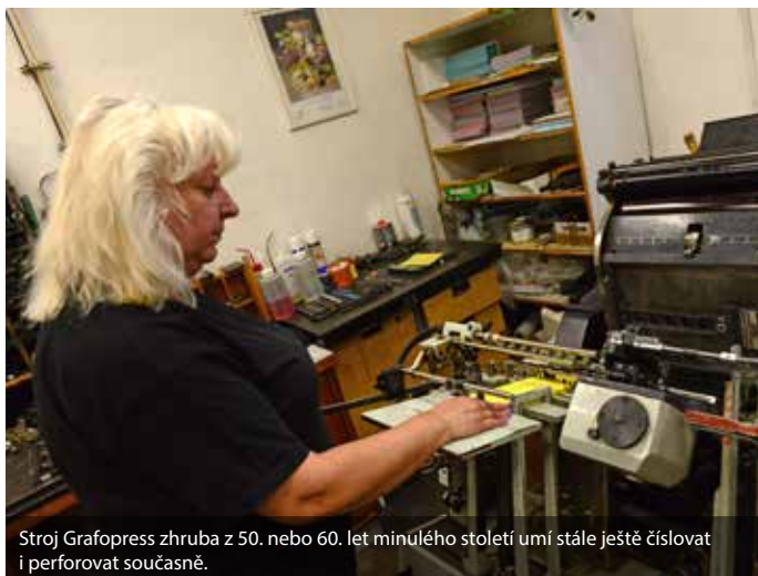
Stroj Grafopress zhruba z 50. nebo 60. let minulého století umí stále ještě číslovat i perforovat současně.

Ačkoli by se mohlo zdát, že nové digitální technologie jsou nepřitelem ofsetového tisku, opak je pravdou. O tisk je stále větší zájem, pouze se mění sortiment. Knihy a noviny se tisknou sice v menších nákladech, ale ve větším počtu druhů. Papírové noviny také ještě digitální technologii neustoupily. V posledních letech však rapidně roste zájem o tisk reklamních tiskovin či propagačních materiálů. „Tisku rozhodně ještě hrana nezvoní. Naopak, s vývojem technologií se nám otevírají stále nové možnosti,“ upozorňuje na závěr Jaroslav Ježek.