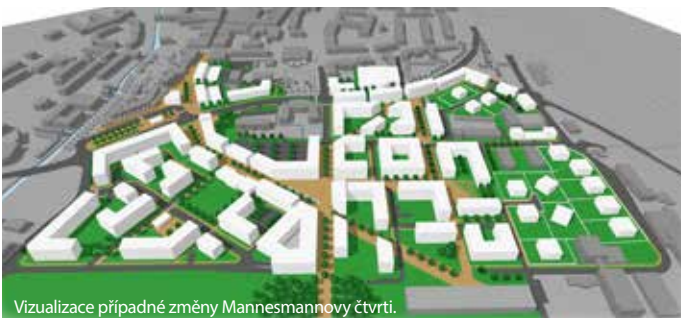
Vizualizace případné změny Mannesmannovy čtvrti.

V lokalitě Sady Březenecká se oproti návrhu projednanému v květnu 2014 již nevažuje s výstavbou velkého obchodního domu. Nově zde mohou být jen rodinné domky a malé komerční objekty. Územní plán neomezuje chov zvířat, ale stanovuje v regulativech omezení výstavby objektů pro chov domácích zvířat. Jsou možné pouze v objektech venkovského typu. U rodinných domků, v zahrádkářských koloniích a v centrálním městě se nesmí stavět s výjimkou kotců pro psy a voliér pro papoušky. Objekty nesmí být určeny na komerční chov.