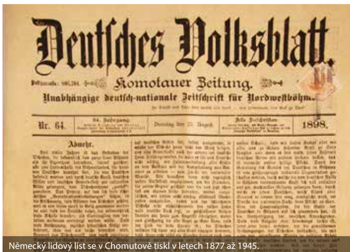
Německý lidový list se v Chomutově tiskl v letech 1877 až 1945.