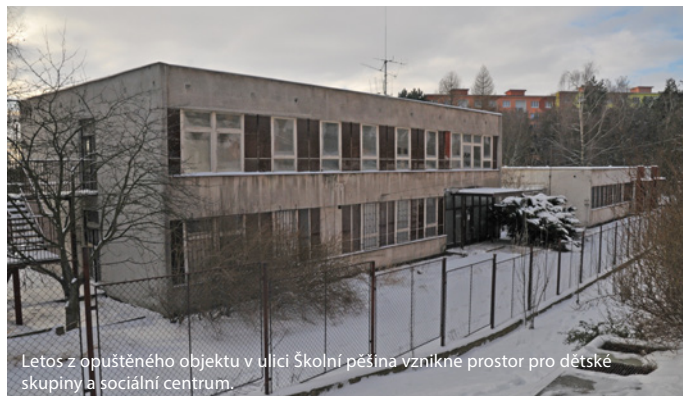
Letos z opuštěného objektu v ulici Školní pěšina vznikne prostor pro dětské skupiny a sociální centrum.

Letos by měla být zahájena i rekonstrukce opuštěného objektu v ulici Školní pěšina, kde vznikne prostor pro dětské skupiny a so- ciální centrum. V plánu investic je také zřízení nové expozice o historii Chomutova v radničním sklepení, revitalizace rozária a blud- iště v městském parku, dokončení oprav toalet v letním kině, zastře- šení zastávky na Zahradní a vy- budování nových kontejnerových