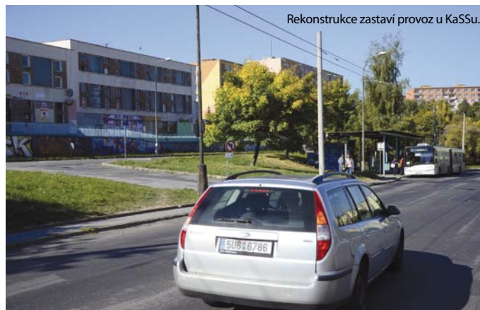
Rekonstrukce zastávky provozu u KaSSu.

V druhé etapě se počítá se zúžením hlavní silnice, posunutím zastávky MHD, zasypaním podchodu u zdravotního střediska a opravením druhého podchodu. Velkou změnou projde parkování. U obchodní části KaSSu vznikne nová fontána, podium i klidová zóna.