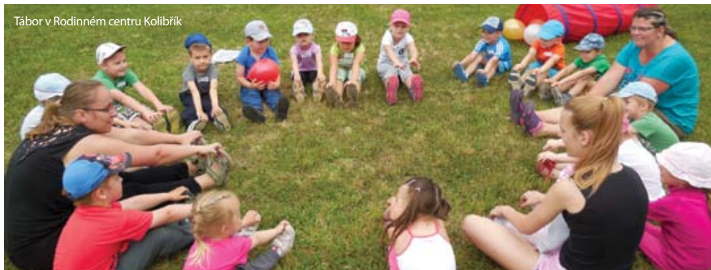
Tábor v Rodinném centru Kolibřík