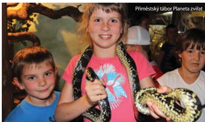
Příměstský tábor Planeta zvířat

Chomutovské rodiny čeká v těchto dnech důležité rozhodnutí, musejí si totiž vybrat pro své dítě ten nejzajímavější příměstský tábor či jinou zábavu. Rozhodnutí to není lehké, chomutovské organizace totiž prázdninových aktivit nabízejí nepřeborné množství. Děti školního i předškolního věku budou o prázdninách tančit, plavat, sportovat, poznávat nová místa i se zábavnou formou učit. To vše pod dohledem a jen kousek od domova.