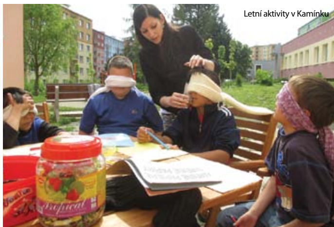
Letní aktivity v Kamínku