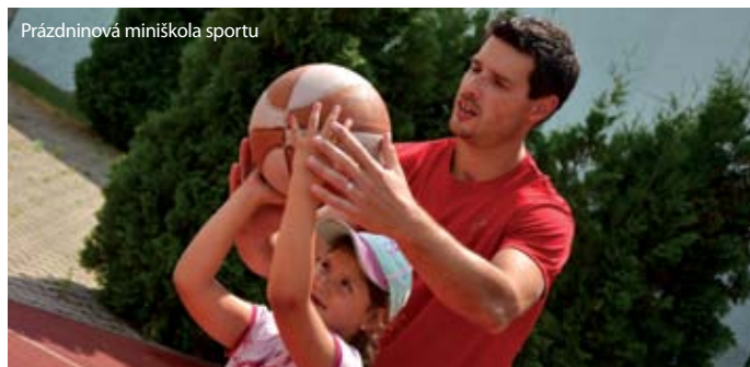
Prázdninová miniškola sportu

Každý prázdninový čtvrtek se v dětském oddělení chomutovské knihovny sejdou malí umělci. Ti budou každý týden malovat a tvořit na jiné téma, čas jim uteče v příjemné at-