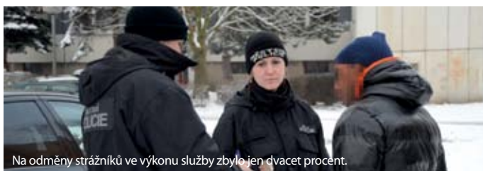
Na odměny strážníků ve výkonu služby zbylo jen dvacet procent.

Městská policie na sklonku loňského roku zaplatila za nákup čtyř nových elektroskútrů, ty byly přijaty na sklad, dostaly evidenční číslo, kartu a v době auditu se skútry nenašly. „Při pátrání po tom, jestli by nám byl někdo schopen doložit fakturu, smlouvu, objednávku, tak se kromě faktury nenašlo nic a bylo nám řečeno, že skútry mají problém s homologací a nemají certifikáty a budou dodány později,“ řekl náměstek. Od nákupu uplynulo téměř šest měsíců a skútry stále nejsou. Město tak zaplatilo 300 tisíc za něco, co dodnes nemá. Navíc k trans-