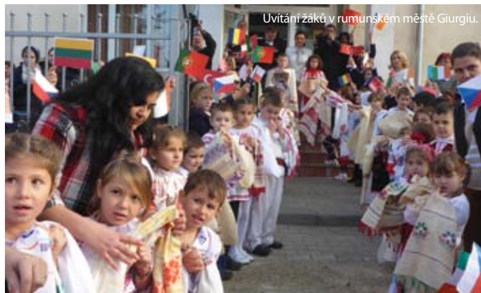
Uvítání žáků v rumunském městě Giurgiu.

Na Příkopech již navštívili téměř všechny spřátelené školy, ještě je čeká poslední výlet. V červnu se podívají do Irska. Seznámí se s tradicemi v této zemi a jelikož budou ubytováni v tamních rodinách, procvičí si také angličtinu.