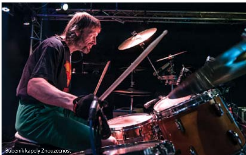
Bubeník kapely Znouzectnost

Program mezi pátkem a sobotou ohraničí půlnoční vystoupení skupiny Eddie Stoilow, která se v roce 2012 stala Skokanem roku v anketě Český Slavík a zaujala mimo jiné tím, že s ní občas vystupuje jako příležitostný bubeník reprezentační brančář Petr Čech. Skupina Nylon Jail nabídne hudbu, která se opírá o atmo-