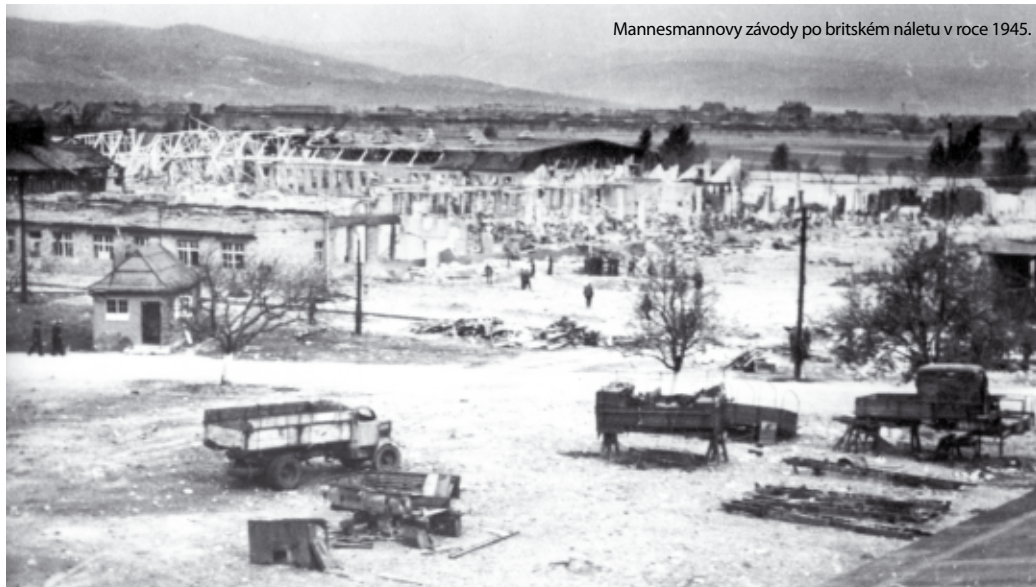
Mannesmannovy závody po britském náletu v roce 1945.