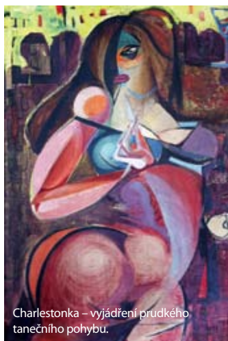
Charlestonka – vyjádření prudkého tanečního pohybu.

„Strukturální nová figurace už nepředpokládá dokonalý obraz reality. Například už není nutné kreslit detailně celou ruku, stačí ji naznačit v gestu, které je pro obraz ústřední. Nemá to být abstrakce, tyto obrazy mají asociovat tvar a skrze lehkou nadsázku odrážet pocity,“ dodává Kamil Sopko ke své umělecké cestě.