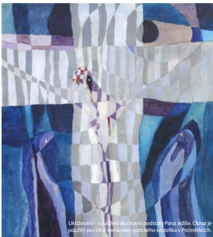
Ukřižování – vyjádření duchovní podstaty Pana Ježíše. Obraz je použitý pro oltář románsko-gotického kostelíka v Počedčicích.

Na výstavě lze pozorovat nejen známá malířova díla, ale také obrazy, které Kamil Sopko měl uložené na půdě. „Je to trošku taková mímě sentimentální reminiscence, ale člověk tak aspoň vidí spojitosti. Nyní chápu to, jak člověk hledá svůj princip umění, a věřím, že i já jsem ke svému výsledku došel,“ uzavírá malíř Kamil Sopko.