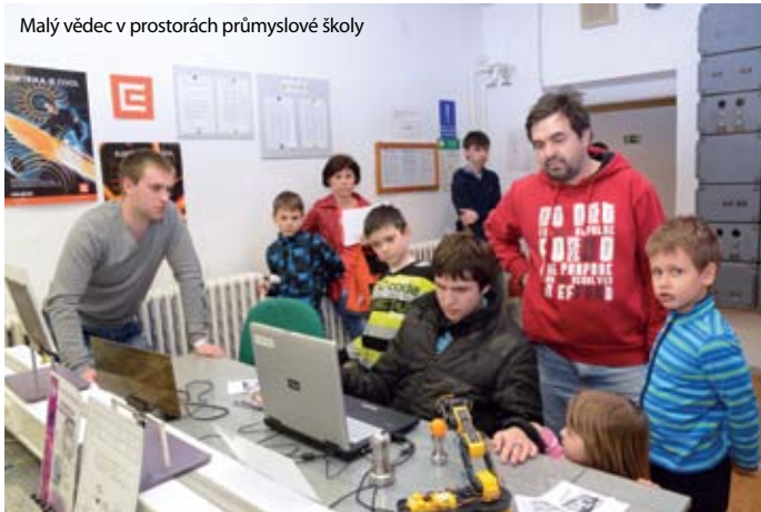
Malý vědec v prostorách průmyslové školy