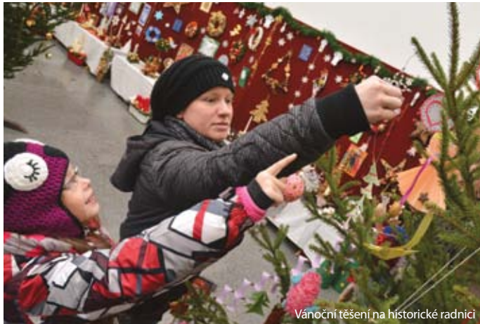
Vánoční těšení na historické radnici