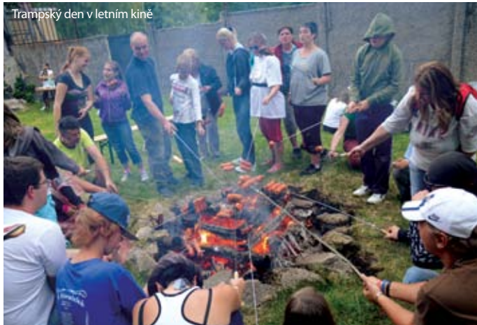
Trampský den v letním kině