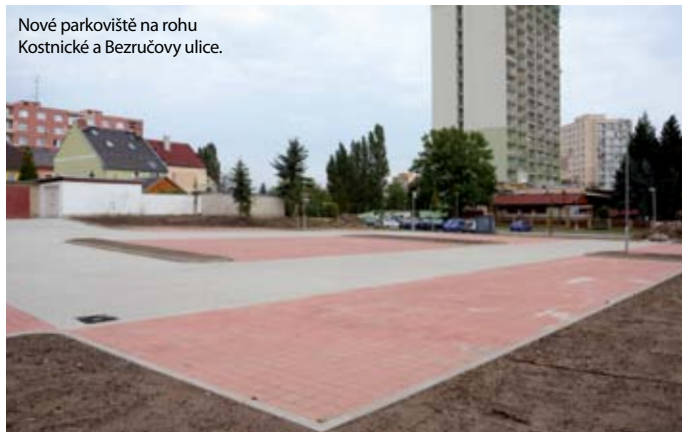
Nové parkoviště na rohu Kostnické a Bezručovy ulice.

Řidiči budou moci od konce listopadu jezdit po zcela nové silnici. Ta vznikne z příjezdové cesty vedoucí k rodinným domům v ulici Pod Strání. Podél silnice povedou nové chodníky a vše bude náležitě osvětleno. Dále přibudou kontejnerová