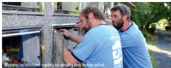
Opravy na hřbitově vyjdou na desítky tisíc korun ročně

Zloději ročně na zařízení hřbitovů způsobí škodu za několik desítek tisíc korun. Kradou vodovodní ventily, konve, litinové kryty fontán, antikorové rámečky. Toto všechno pak technické služby ze svého rozpočtu opravují či nahrazují. Kromě toho se ale ztrácejí daleko cennější věci, a to výzdoba hrobů či uren. Návštěvníkům hřbitova nezbyvá, než se společně se zaměstnanci semknout a jít do boje se zloději vlastní všímavostí a pohotovostí.