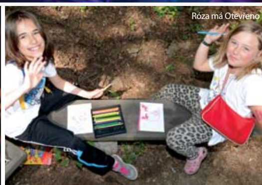
Róza má Otevřeno