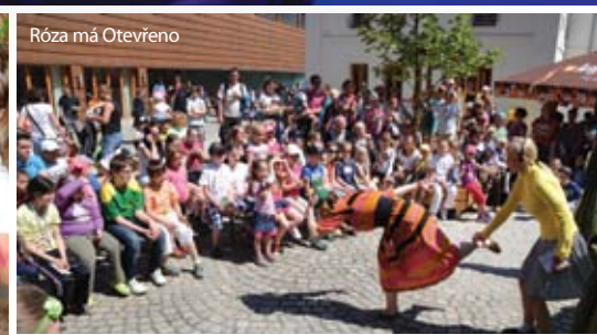
Róza má Otevřeno