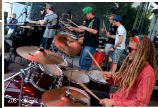
ZUS – Oklep