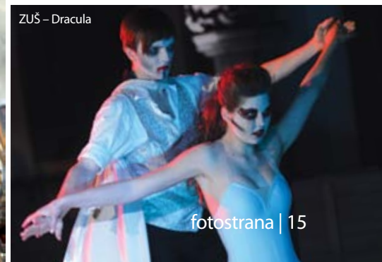
ZUŠ – Dracula