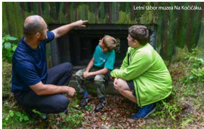
Letní tábor muzea Na Kočičáku.