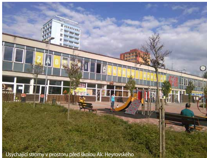
Usychající stromy v prostoru před školou Ak. Heyrovského

storu spojky, chodník mezi ulicemi Jiráskova a Havlíčkova, bylo odstraněno technickými službami 8 laviček bez náhrady. Posedávali tam pejskaři, důchodci i maminy, které čekaly na děti z taneční školy nebo z Domečku. Lavičky zůstaly