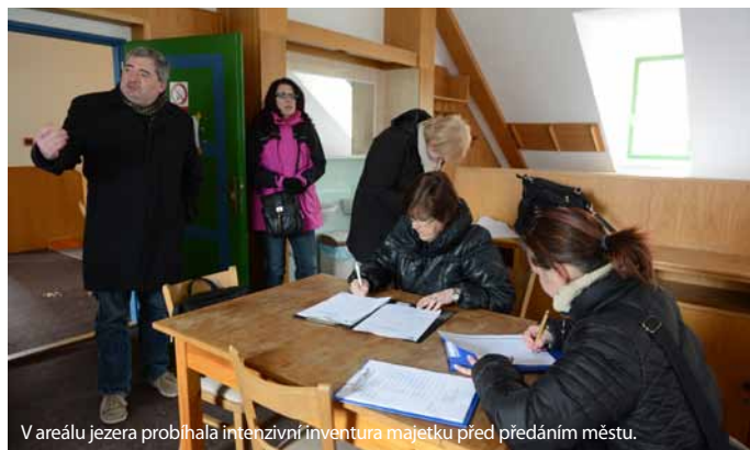
V areálu jezera probíhala intenzivní inventura majetku před předáním městu.

dat o trpělivost a pochopení. Letošní sezona nebude na Kamenčáku sto procentně komfortní. Určitě se to promítne i do cen vstupného, které snížíme,“ dodává primátor Daniel Černý.