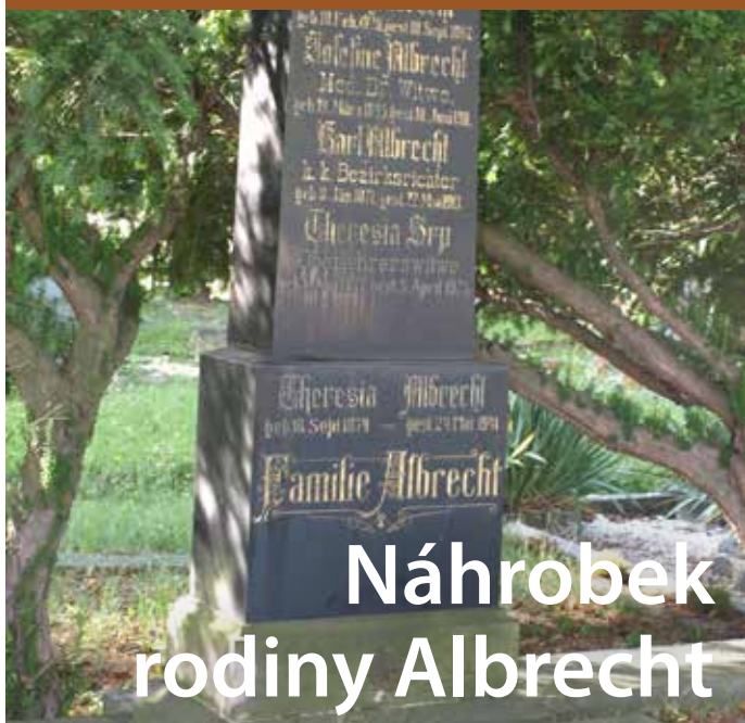
Náhrobek rodiny Albrecht

Náhrobek rodiny Albrecht je jedním ze stylově nejčistších příkladů funerální kultury, typické pro období přelomu 19. a 20. století. Podržel si ji až do doby uložení posledního příslušníka rodiny v roce 1945. Jednoduchý komolý jehlan vyniká umělecky provedenými secesními nápisy, které se dochovaly téměř nedotčené.