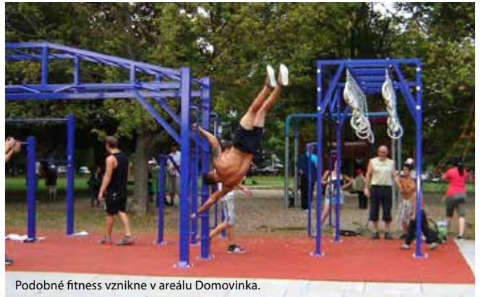
Podobné fitness vznikne v areálu Domovinka.