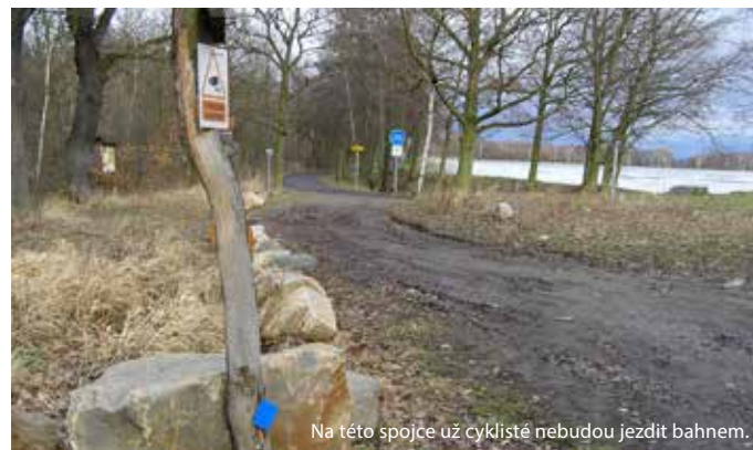
Na této spojkce už cyklisté nebudou jezdit bahnem.

Na kraji městského parku u lázní budou obnoveny nakloněné květinové hodiny, které se zde nacházely před padesáti lety. Hodiny budou mít takovou květinovou výsadbu, která není náročná na údržbu a bude vyhovovat daným klimatickým podmínkám. Vznikne tím atraktivní místo pro fotografování turistů i místních. Náklady na projekt se pohybují zhruba ve výši 200 tisíc korun.