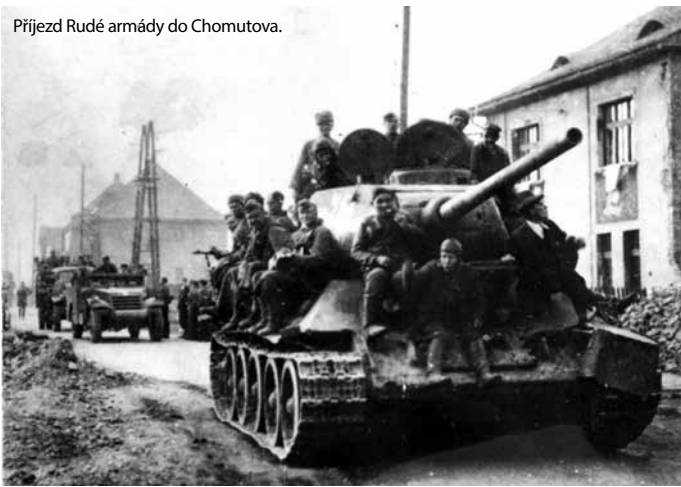
Příjezd Rudé armády do Chomutova.

Od začátku druhé světové války zajala vítězná německá armáda obrovské množství nepřátelských vojáků, které bylo nutno přesunout daleko od jejich vlastí, aby se nemohli v budoucnu opět zapojit do boje proti Německu. Ty a později i civilní obyvatelstvo z okupovaných zemí bylo možné navíc efektivně využít na práci k podpoře německé válečné mašinérie, které chyběli muži nasazení na frontách.