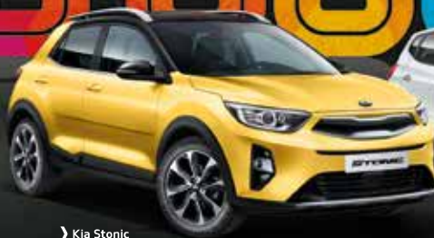
› Kia Stonic