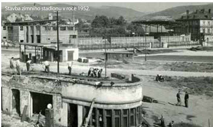
Stavba zimního stadionu v roce 1952.