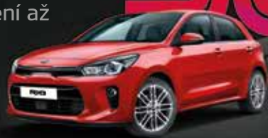
› Kia Rio