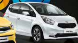
› Kia Venga