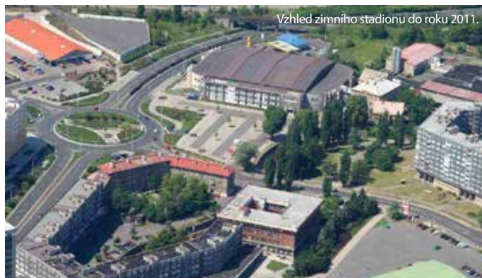
Vzhled zimního stadionu do roku 2011.

V listopadu 1952 ale sledovalo z tribun tehdy v Chomutově velmi populární zápasy v ledním hokeji na deset tisíc lidí. Diváci, na které už nezbylo místo na stadionu, se dívali z korun okolních stromů. Kluziště s uměle vyráběným ledem, nezávislé na rozmarech počasí, znamenalo pro chomutovský hokej obrovský přínos. Bylo to ale provizorní a polovičaté řešení. Bez zbytečných