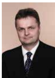
Kaiser Petr ANO 2011