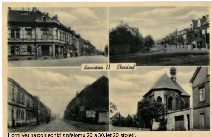
Horní Ves na pohlednici z přelomu 20. a 30. let 20. století.

1928 s tím, že nová obec ponese název Chomutov. Zhruba po sedmdesáti minutách jednání byl návrh jednomyslně přijat. Hned následující den byla vyvěšena příslušná vyhláška s tím, že případné námítky proti sloučení mohou být podány do 15. října.