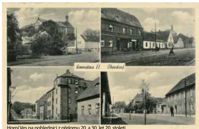
Horní Ves na pohlednici z přelomu 20. a 30. let 20. století.

Sloučení Chomutova s Horní Vsi značně usnadnilo správu téměř třicetitisíkové aglomerace, kterou až do té doby vykonávaly dva samosprávné úřady. To mělo za důsledek rychlejší a kvalitnější rozvoj města a tím i spokojenější život jeho obyvatel.