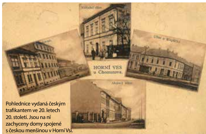
Pohlednice vydaná českým trafikantem ve 20. letech 20. století. Jsou na ní zachyceny domy spojené s českou menšinou v Horní Vsi.