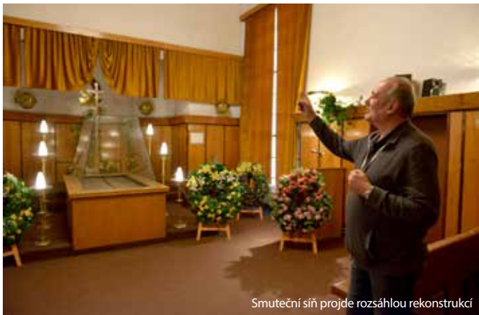
Smuteční síň projde rozsáhlou rekonstrukcí

Rekonstrukce chomutovské smuteční síně se rychle blíží. Ke konci listopadu by v ní už měla naplno pracovat stavební firma. Provoz pohřební služby tím ale přerušen nebude. „Po dobu oprav obřadní síně, která se odhaduje