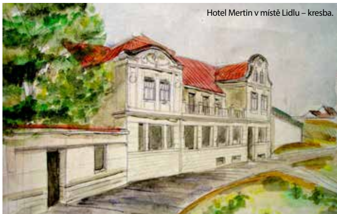
Hotel Mertin v místě Lidlu – kresba.

Jména chomutovských stavitelů známe až z doby velké výstavy města v poslední třetině 19. století. Velké stavby od 13. do 18. století prováděly většinou stavební huti a stavitelé, kteří do Chomutova přicházeli odjinud. Velký stavební rozvoj ve městě si vynutil vznik několika místních stavebních firem.