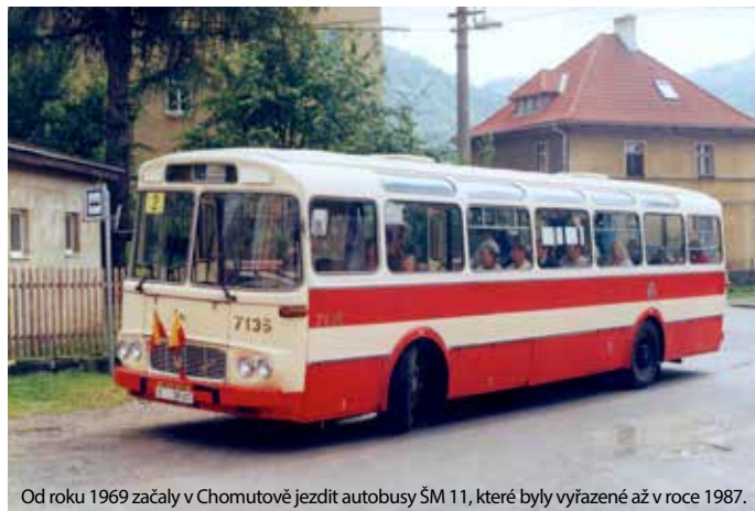
Od roku 1969 začaly v Chomutově jezdit autobusy ŠM 11, které byly vyřazeny až v roce 1987.

V 80. letech měl Chomutov už téměř 50 tisíc obyvatel, doprava opět přestávala stačit. „Už v roce 1982 se začalo mluvit o vybudování tramvajových kolejí, aby se doprava posílila. V roce 1984 se uvažovalo i o tom, že by mohly na tramvaje navazovat trolejbusy. Jenže k výstavbě nedocházelo a doprava se zhoršovala. V roce