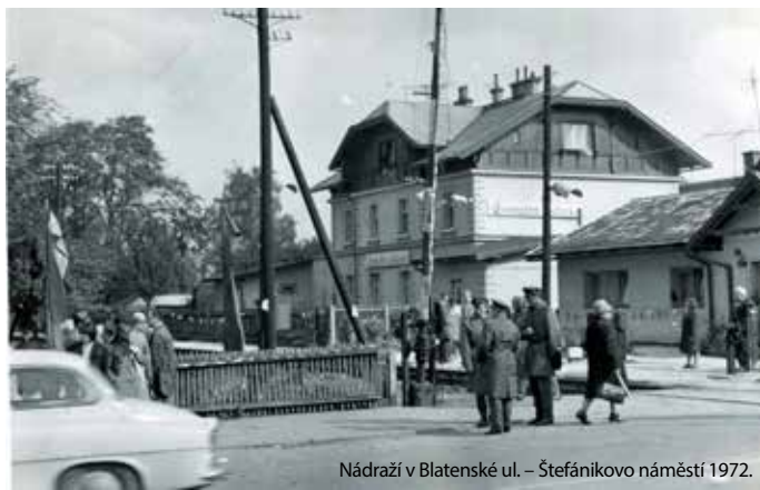
Nádraží v Blatenské ul. – Štefánikovo náměstí 1972.