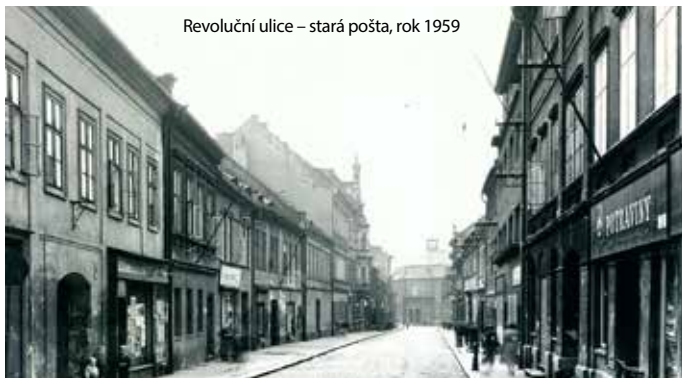
Revoluční ulice – stará pošta, rok 1959