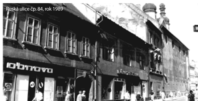
Ruská ulice čp. 84, rok 1989