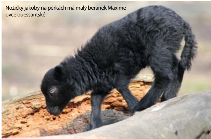
Nožičky jakoby na pérkách má malý beránek Maxime ovce ouessantské