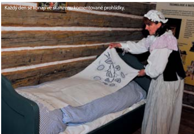
Každý den se konají ve skanzenu komentované prohlídky.