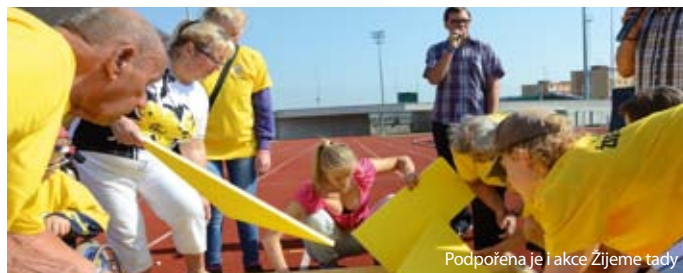
Podpořena je i akce Žijeme tady

Osmdesát osm žadatelů požadovalo více než 3,6 milionu korun. Rada města nakonec schválila dotace celkem za více než jeden milion korun pro 65 žadatelů. „Při schvalování hodnotíme zejména zapojení mládeže a veřejnosti na akci, zda se jedná o akci místního, regionálního, celostátního či mezinárodního charakteru, hospodárnost projektu a podíl spolufinancování, ale také zkušenosti ze spolupráce s žada-