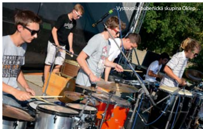
Vystoupila bubenická skupina Oklep...

Sbírce byl věnován i program druhého dne Žijeme tady pod názvem Každé kolo pomáhá. Návštěvníci si za symbolickou pětikorunu zakoupili lístek na in-line dráhu na Zadních Vinohradech, zasportovali si a přispěli tak svou troškou ke sbírce. „Akce předčila naše očekávání. Koncert ve velké konkurenci fotbalu a hokeje na-