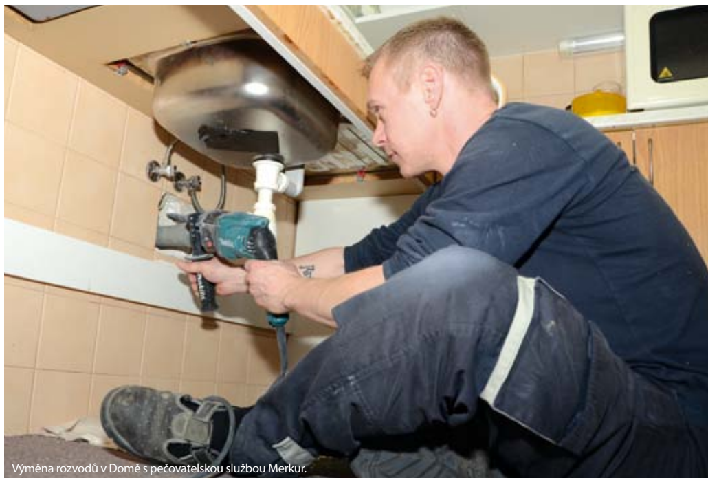
Výměna rozvodů v Domě s pečovatelskou službou Merkur.

Já jsem v tom bytě nebydlel. Nájem platila manželka (manžel). Vždyť mně nikdo neposlal upozornění. Nedostal jsem platební rozkaz. O dluhu jsem nevěděl (i když nájemník podepsal uznání dluhu).