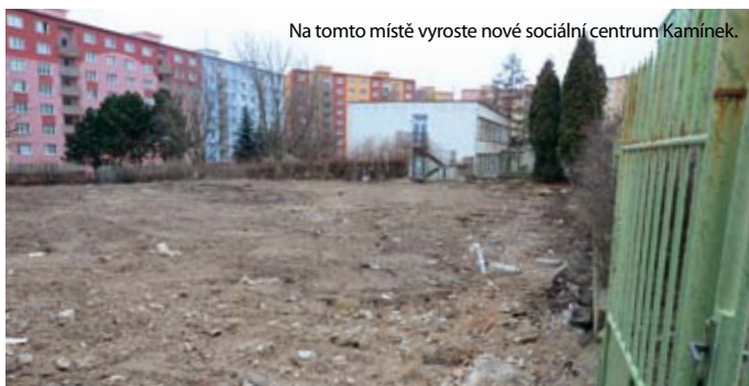
Na tomto místě vyroste nové sociální centrum Kamínek.

Zájemci z řad starších obyvatel Chomutova si už brzy budou moci zdarma pilovat fyzickou kondici. V lesoparku v blízkosti sídliště Písečná totiž v létě přibude devět posilovacích strojů, které by měli využívat obyvatelé z blízkého domova pro seniory. Nový systém cest k nim navíc umožní bezbariérový přístup.