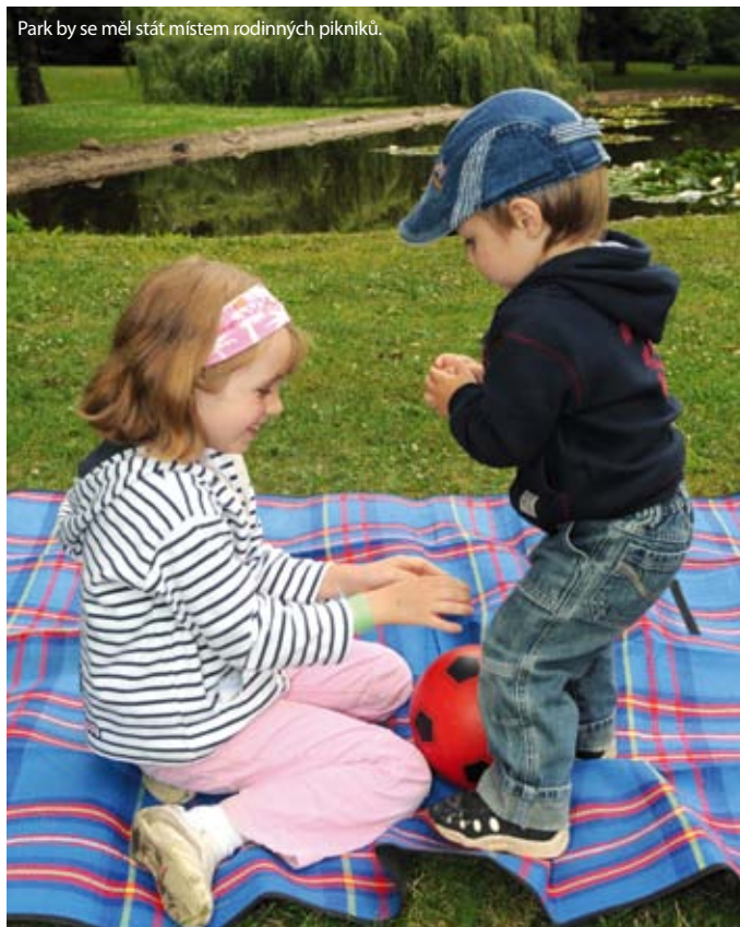
Park by se měl stát místem rodinných pikniků.

Investice je součástí obnovy zeleně v části sídliště, která si klade za cíl dnešní lesoparkovou podobu přeměnit do podoby parku. Posilovací stroje budou rozmístěny do vycházkového okruhu. Kromě výsadby nových stromů a keřů záměr počítá i s odstraněním starých či nemocných dřevin.