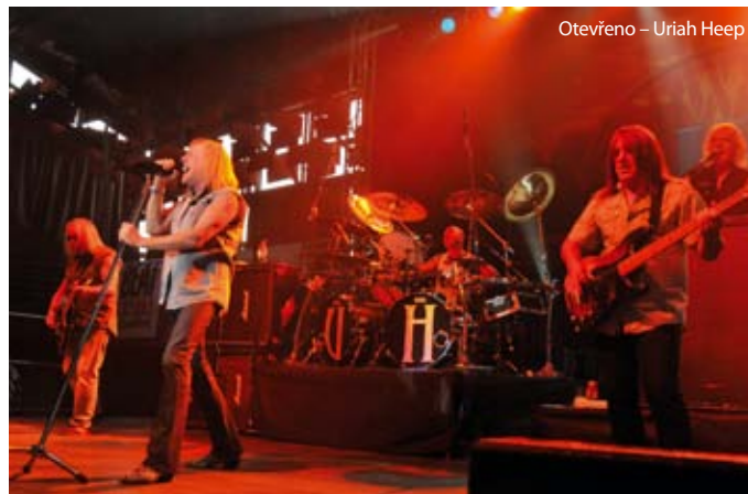
Otevřeno – Uriah Heep

Velký prostor ve městě patří výtvarnému umění, kterému vévodí galerie Špejchar. Tě své obrazy svěřily přední osobnosti Oldřich Kulhánek, výtvarníci spojení s galerií La Femme, Jan Saudek či kontroverzní Milan Knížák. „Galerie je mezi výtvarníky hodnocena jako jedna z nejlepších