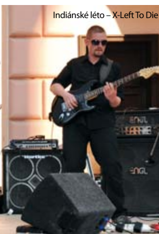
Indiánské léto – X-Left To Die