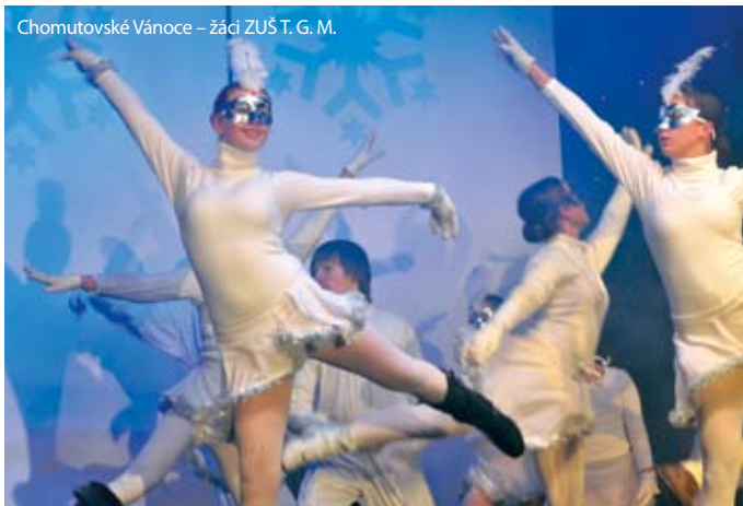
Chomutovské Vánoce – žáci ZUŠ T. G. M.

Kulturní akce mohou mít i přímý společenský účel. Muzeum už třetím rokem pořádá Muzejní noc inspirovanou životem etnických a národnostních minorit. „Působí zde sedm národnostních menšin a nám se zdálo, že by bylo dobré, kdyby se společně představily veřejnosti,“ vysvětlil ředitel Děd, proč se muzeum rozhodlo jít do spolupráce