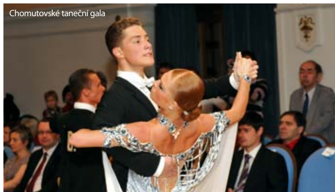
Chomutovské taneční gala