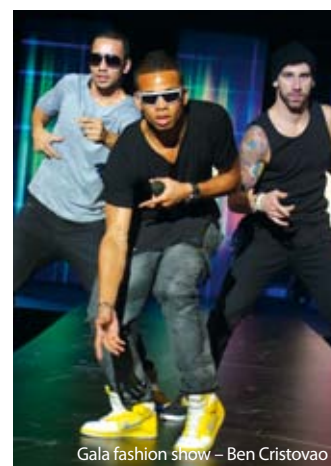
Gala fashion show – Ben Cristovao