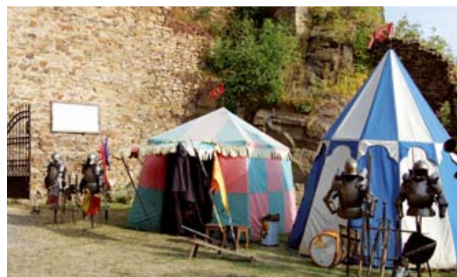
Dobývání hradu Hasištejn.