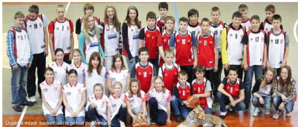
Úspěšní mladí basketbalisté pěkně pohromadě.