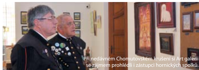
Při nedávném Chomutovském krušení si Art galerii se zájmem prohlédli i zástupci hornických spolků.