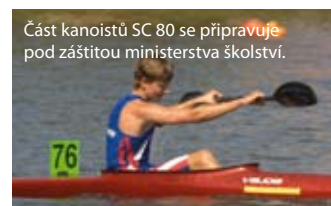
Část kanoistů SC 80 se připravuje pod záštitou ministerstva školství.

V Chomutově se daří i zástupcům dalších klubů a sportovních odvětví. Ostatně o některých z nich se můžete dočíst i na straně 10. A protože město Chomutov mládežnický sport podporuje nejen materiálně, poskytovat prostor na sportovní straně bude mládežníkům v každém čísle Chomutovských novin.