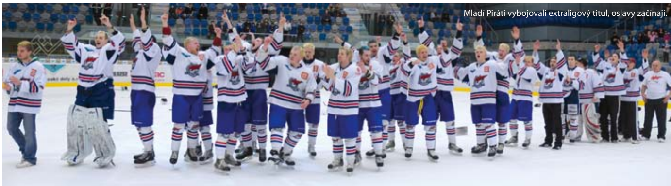
Mladí Piráti vybojovali extraligový titul, oslavy začínají.