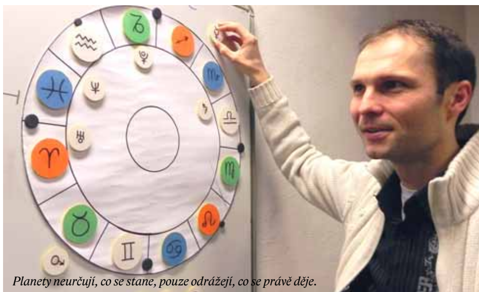
Planety neurčují, co se stane, pouze odrážejí, co se právě děje.

Proto si myslím, že je důležité ukazovat a posuzovat astrologii zejména v dějinném kontextu, než skrze to, co se dnes nabízí, učí a vydává. Z různých současných astrologických směrů je mně nejbližší astrologie psychologická, která klade důraz na pochopení naší podstaty a na rozvíjení vloh, které jsou nám dány při zrození. A možná i proto, že se zaměřuje na podstatu více než na výklad budoucnosti. Planety nás neovlivňují, pouze nám umožňují pochopit rozložení naší psychické struktury, kterou máme rozvíjet ve svém životě.