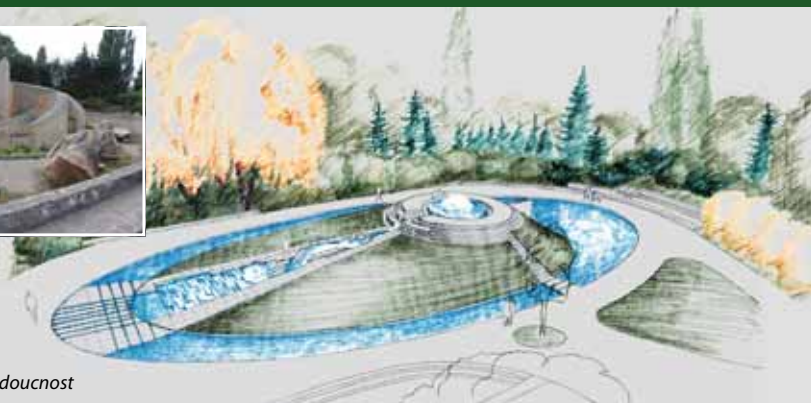
... a možná budoucnost