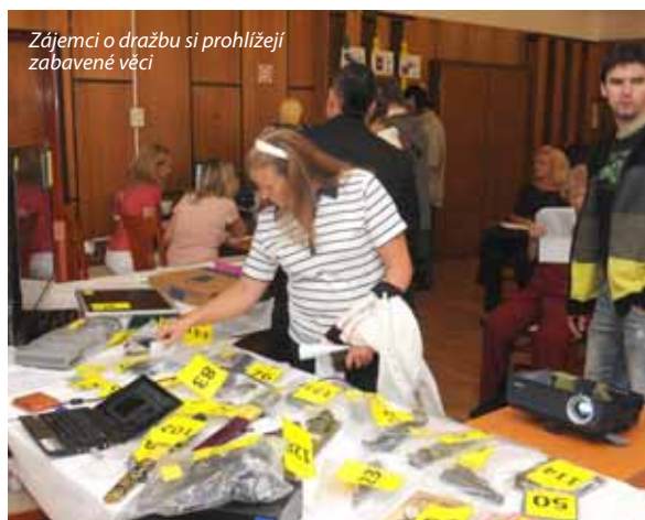
Zájemci o dražbu si prohlíží zabavené věci