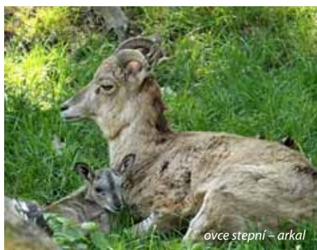
ovce stepní – arkal