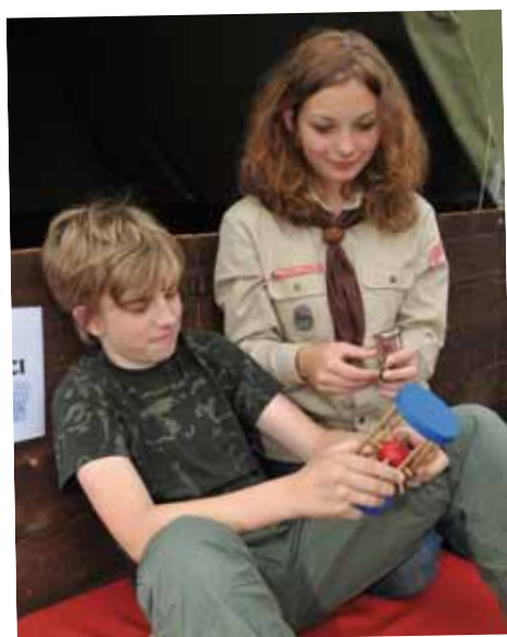
Junáci si vytvořili vlastní tábor, na kterém představili všechny aktivity, které se odehrávají na táboře od stavění stanů až po vaření v kuchyni. Nechyběl ani legendární ježek v kleci.