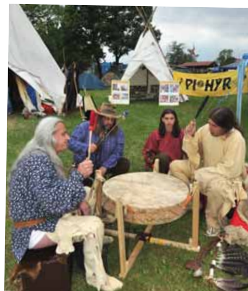
Poznat život severoamerických indiánů mohli návštěvníci na stanovišti pionýrů. Tance, oblečení, a hry i tradiční teepee vypadaly naprosto opravdově.