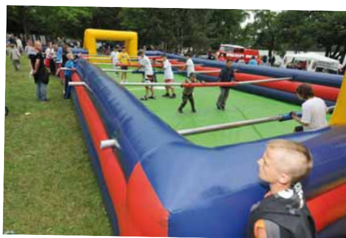
Velkou atrakcí byl nafukovací stolní fotbalík.

níky, divadelníky nebo florbalisty. Napínavou podívanou pak nabídly závody dračích lodí pro žáky základních škol, kteří mocnými úderů pádel rozhoupali hladinu jezera. „Vítězem se stala Základní škola Krušnohorská z Jirkova,“ dodal Märč. Letos Bambiriádu navštívilo sedm tisíc dětí a rodičů.