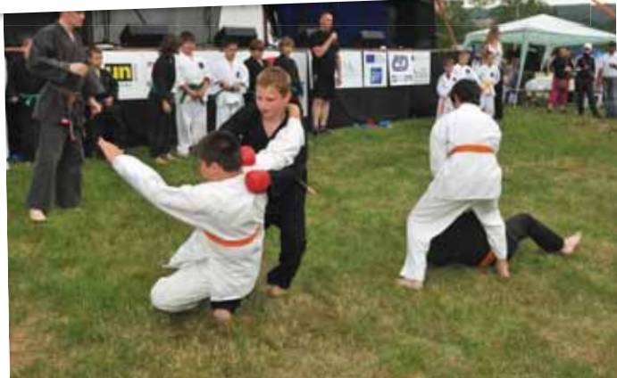
Na pódiu a pod ním se vystřídalo na pět set dětí. Na snímku ukázka bojových umění Tiger Relax klubu.