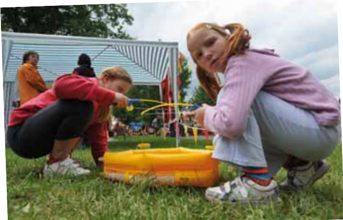
Domeček, jako hlavní organizátor chomutovské Bambiriády, se postaral hlavně o nejmenší děti. Stan Domu dětí a mládeže sloužil jako hlavní infostánek se všemi informacemi.