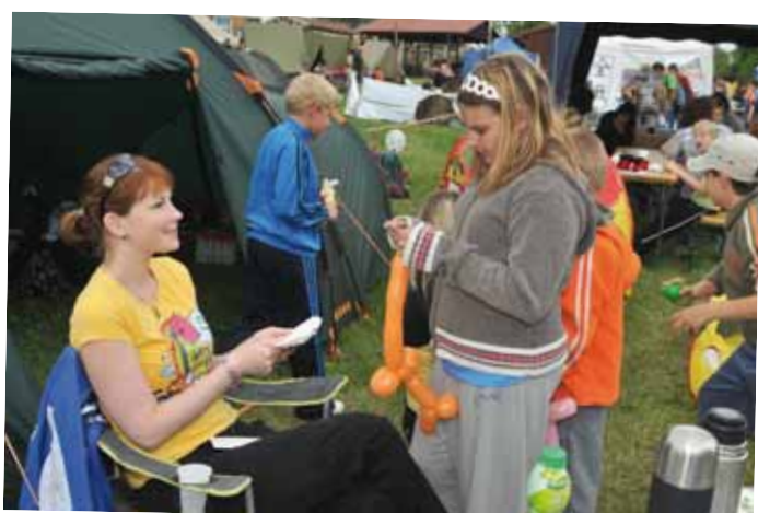
Na Bambiriádě se představila řada neziskových organizací. I chomutovský Klokánek měl připravené pro děti soutěže a hádanky