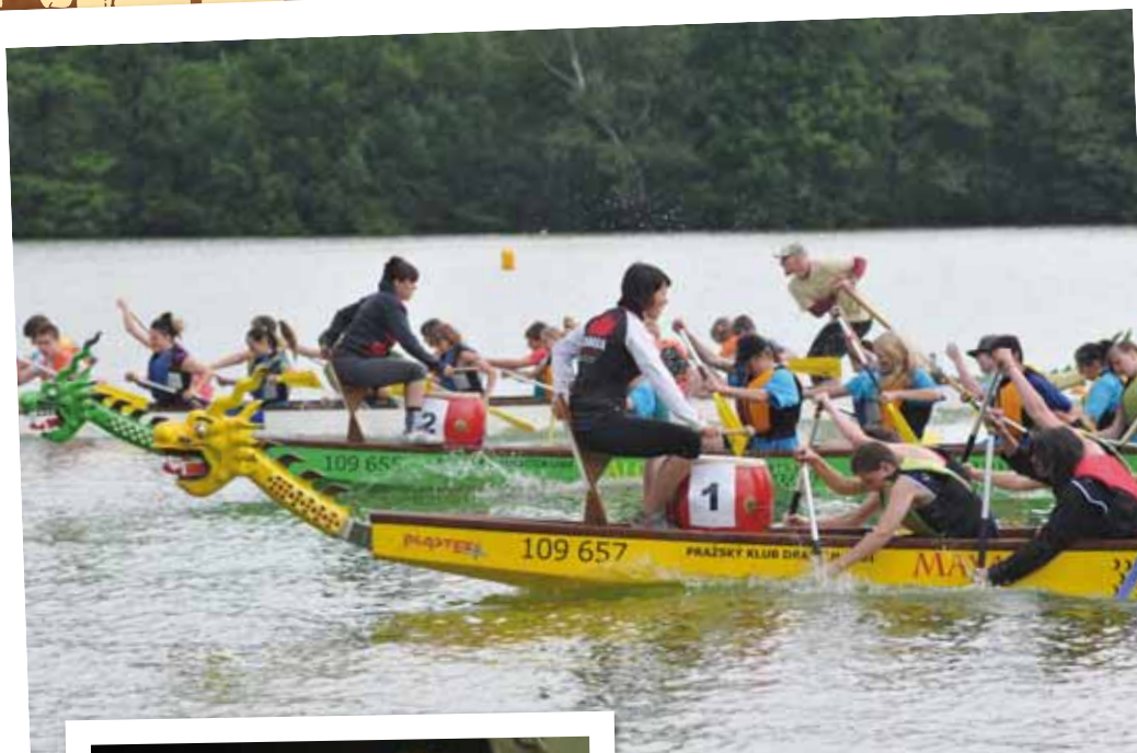
Poprvé se na Bambiriádě jely závody dračích lodí. Tentokrát se jednalo o meziškolní soubor chomutovských a jirkovských škol.