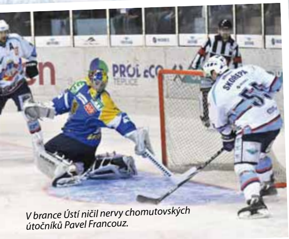
V brance Ústí ničil nervy chomutovských útočníků Pavel Francouz.