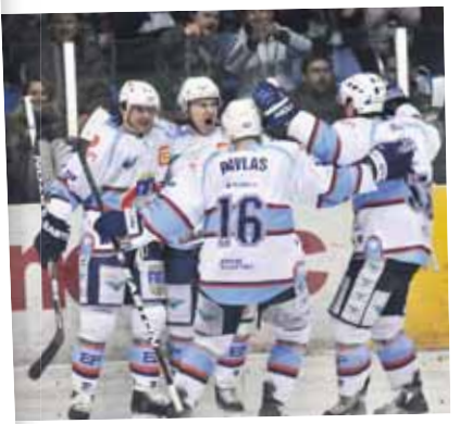
Vítězná radost Pirátů skončila po semifinálové sérii.