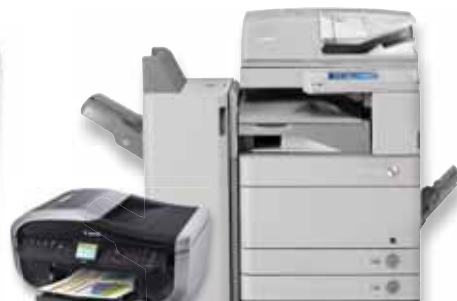
kancelářská a kopírovací technika