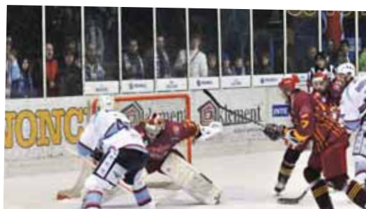
Proti Jihlavě si Chomutovští zastříleli. Druhý domácí zápas vyhráli 6:0.