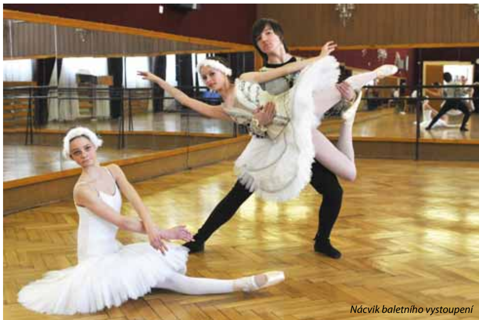
Nácvik baletního vystoupení