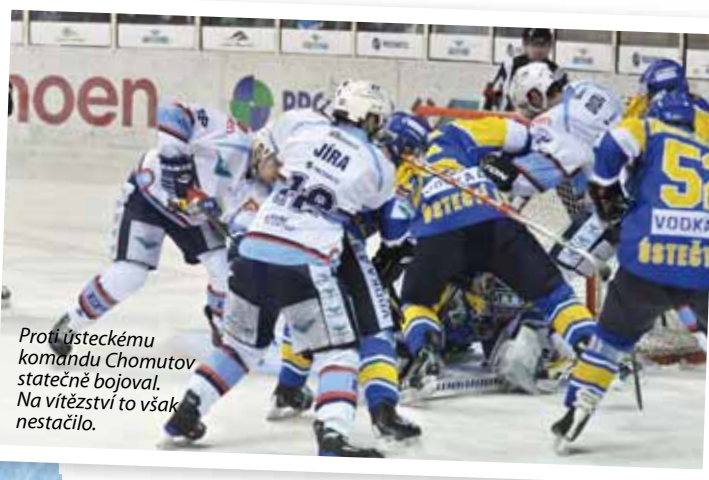
Proti ústeckému komandu Chomutov statečně bojoval. Na vítězství to však nestačilo.

Jestliže si během základní části Piráti museli prožít nejednu bouři, začátek vyřazovacích bojů jim vrátil