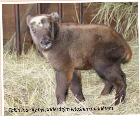
Takín indický byl padesátým letošním mláďetem

vočelých psů. Samice byla u chovného samce v olomoucké zoo. Stádo sobů se pomalu rozrůstá. K původní chomutovské samici se připojily dvě samice nově dovezené z Prahy. Stádo by měl v nejbližší době rozšířit také chovný samec soba polárního. Výběh sobů se tak po loňském neštěstí zase zaplní a v budoucnu jej snad rozveselí i přítomnost mláďat.