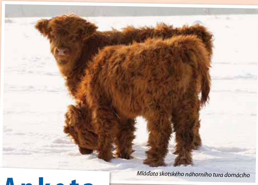
Mláďata skotského náhorního tura domácího

Podkrušnohorský zoopark mají návštěvníci z Chomutova i okolí stále raději. Potvrzuje to jejich stálý zájem. Zoopark pro ně také nabízí stále více novinek. Novinkou bude pro návštěvníka zootombola a pro ty, kdo si zakoupí od dubna permanentní vstupenku, čeká příjemné překvapení. Za poslední dva roky se výrazně oživila expozice terarijních zvířat a druhově se rozrostl chov vzácných jeřábů. Rozšířila se také nabídka atrakcí a informací pro malé i velké návštěvníky. Pracuje se na dokončení nové expozice ve skanzenu Stará ves. V květnu se budou otvírat nové expozice, které přiblíží návštěvníkům život, tradice a práci našich předků v oblasti Krušných hor. Ke zhlédnutí budou ukázky dobových zemědělských strojů a náradí, historie včelařství, výroba hraček, čizbářství a bylinkářství. Výukové programy v letošním roce nově využila i řada seniorů při přednáškách v jejich klubech. Vloni zoo navštívilo 216 400 návštěvníků.