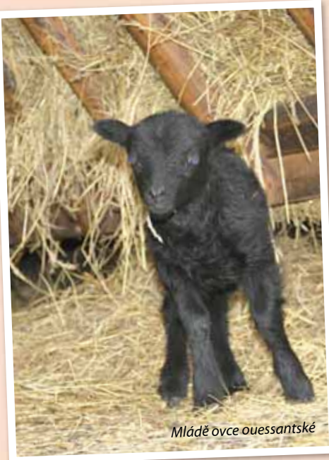
Mládě ovce ouessantské