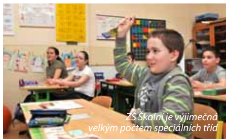
ZŠ Školní je výjimečná velkým počtem speciálních tříd

Těžko posoudit, protože ředitel školy je střídavě manažerem, personalistou, ekonomem, účetním, psychologem, pedagogem, řeší havárie, stavební opravy a úpravy, zda má vyplněné tabulky, statistiky. Je důležité mít kolem sebe lidi, na které se můžu spolehnout, kteří poradí. Ale ředitel musí rozhodnout a za vše zodpovídá. Studovala jsem pedagogickou fakultu a práce s dětmi mě baví nejvíce. Mezi žáky čerpám sílu do další práce.