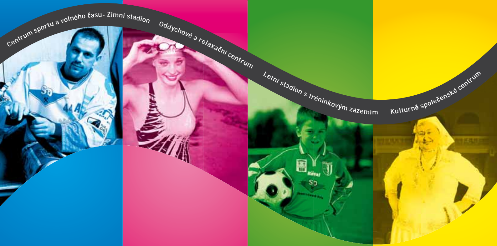
Centrum sportu a volného času- Zimní stadion