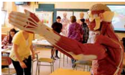
Prezentace učebních pomůcek při dnu otevřených dveří

uplatnění v praxi ale není jediné, co tento obor po složení maturitní zkoušky absolventovi nabízí. Další možností je studium na vysoké škole, zejména v oborech sociální práce, sociální pedagogika a oborech sociálně-zdravotních. Více informací zájemci o studium naleznou také webových stránkách školy www.szsev.cz . (red)