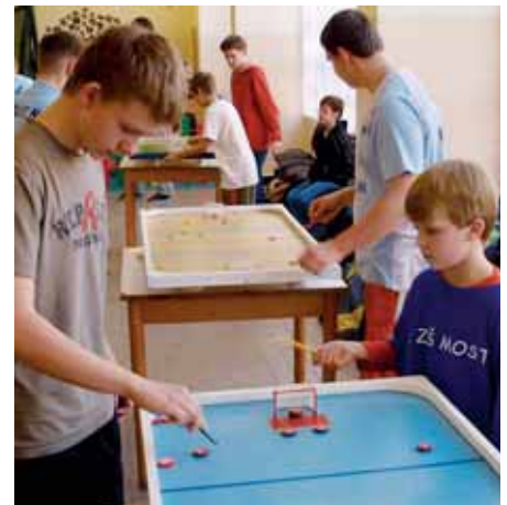
Sdružení mládeže SHSK, Severozápad: Vánoční pohár DDM Chomutov ve šprtci