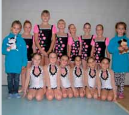
Úspěšné gymnastky MIKA Chomutov po triumfu v Jablonci