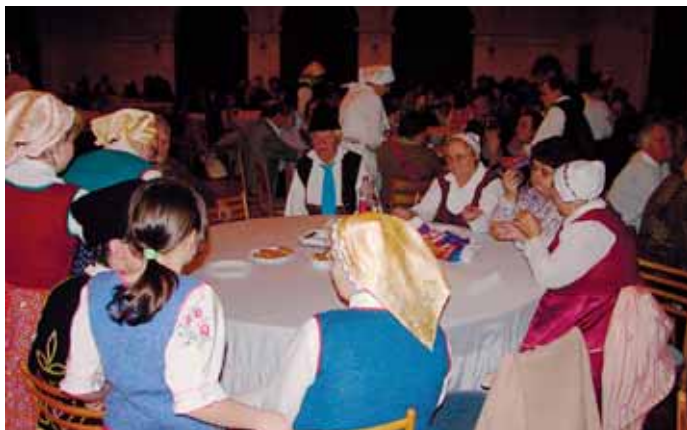
Někteří účastníci večera přišli v krojích.

Slavnostního večera se účastnili zástupci německé, ruské, ukrajinské, maďarské, vietnamské i romské komunity a šlo o skutečně srdečný večer. „Tohle je přesný příklad toho, že lidé spolu dokážou výborně vycházet, ať už mají jakýkoli původ. Jen se musí vzájemně dobře znát. Tady v Chomutově to dělají