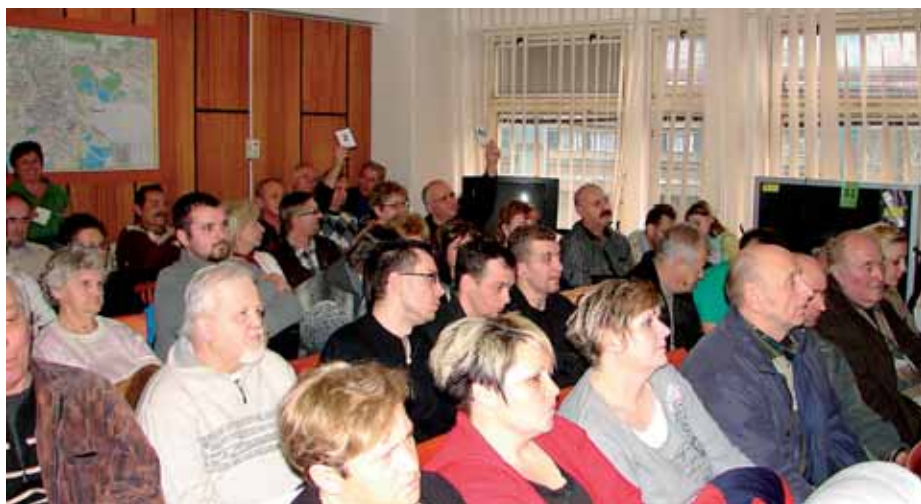
O zabavené věci byl veliký zájem.