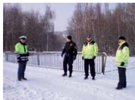
Jedno ze stanovišť, která měli pod kontrolou státní a městští policisté.

V právě poledne zazvonil na služební městské policie telefon. Mužský hlas veliteli směny sdělil, že v Kyjické ulici se v trávě povaluje obnažený muž. Na místo tedy neprodleně vyjela motorizovaná hlídka a byly sem okamžitě nasměrovány i policejní kamery. Když dotyčný zahlédl strážníky, chtěl zmizet v bývalé mateřské školce. Jeho úkryt však byl díky bystrému kamerovému oku odhalen. Začala tedy honička, z níž po chvíli vyšli vítězně strážníci. Protože mladý muž byl zcela dezorientovaný, nevěděl pořádně, co se vlastně děje a byl s největší pravděpodobností pod vlivem návykové látky, byla přivolána záchranná služba. Bezdomovec pak sanitou odjel do nemocnice.