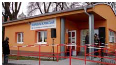
Nová dopravní kancelář

Start kampaně Cestujte s námi a otevření nové dopravní kanceláře Dopravního podniku Chomutova a Jirkova spolu s dalšími zajímavostmi pro cestující uspořádal místní dopravce v minulém týdnu a akce se setkala s velkým ohlasem veřejnosti. „Pochopitelně nás to těší. Nové pracoviště na jirkovském nádraží zase posunuje úroveň cestování o stupeň výš,“ řekl generální ředitel dopravního podniku Jiří Melničuk.