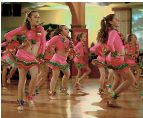
Tak vypadá Havaj v podání TŠ Stardance Chomutov.