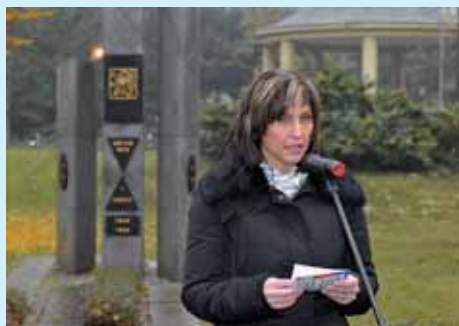
Uctění památky obětí válek a totalit u pomníku v městském parku