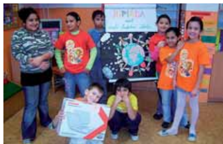
Nadšené děti s novým třídním notebookem.

Únorový multimediální koncert „JUPIÁDA aneb veselá hudební škola“ navštívili i žáci 2. A ze základní školy 17. listopadu.