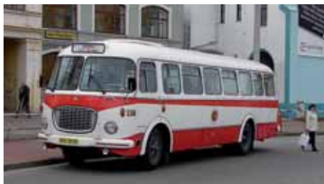
Autobus z muzea