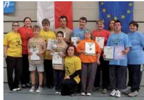
Žáci s medailemi a svými pedagogy

Žáci této školy se účastnili 14. ročníku Eurosportfestu už před dvěma lety a tehdy získali 3 zlaté, 2 stříbrné a 1 bronzovou medaili za štafetu. Letošního ročníku Eurosportfestu, který pořádá partnerské město Annaberg-Buchholz a Christian Felix Weiße Schulle, se zúčastnilo celkem 300 sportovců z německých speciálních škol. Ústecký kraj reprezentovaly děti z Chomutova a z Háje u Duchcova. Družstvo chomutovské školy čítalo šest chlapců a dvě dívky. Soutěžilo se ve čtyřech věkových kategoriích, v každé jak dívky, tak i chlapci, a v disciplínách skok z místa, hod na koš, slalomový běh a běh družstev na překážkové dráze. „Motto letošního Eurosportfestu znělo Sportem k dobré náladě a to opravdu fungovalo. Děti si akci