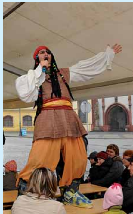
Pořad Divadélka Mazec určený dětem