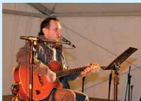
Koncert Karel Kryl Revival