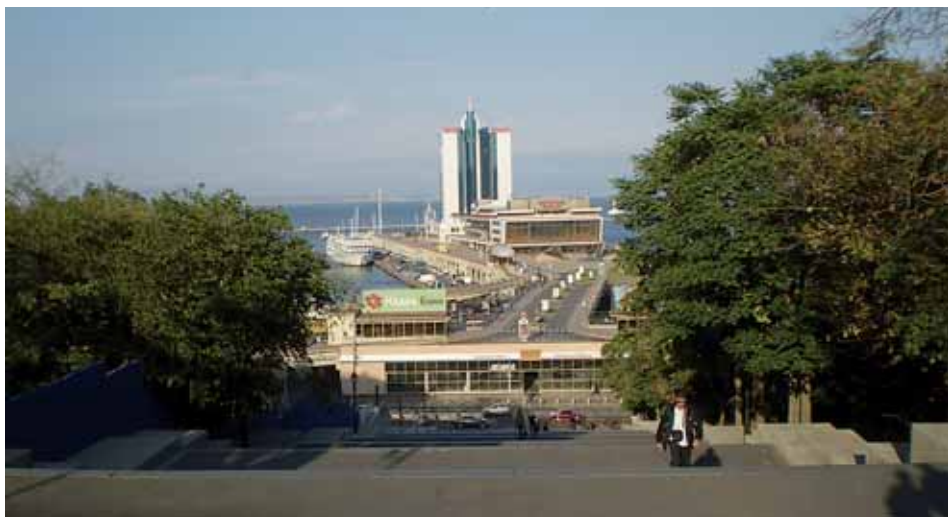
Přístavní město Oděsa.

Na konci září se skupina studentů a jejich učitelů z Chomutovského soukromého gymnázia vydala na východ, do ukrajinského přímořského města Oděsa. Tato expedice před sebou měla hned několik cílů: chtěli poznat jedno z nejkrásnějších černomořských letovišek, kterému se v minulosti přezdívalo „východní Nice“, chtěli také navázat kontakty s jedním z místních gymnázií, sejit se se zástupci komunity oděských Čechů a také zjistit, co vědí místní lidé o České republice a jaký mají názor na nás Čechy. Poznat Oděsu není tak snadné. Je to lázeňské město i velký přístav, město plné zeleně, kultury a historických památek a současně také velké obchodní centrum Ukrajiny. Všechny stránky města studenti poznat ani nemohli, ale navštívili alespoň ty nejnámější památky, ke kterým patří Puškinovo muzeum, Muzeum východního a západního umění, viděli slavné Potěmkino schodiště i přístav, městský park i gubernátorský palác.