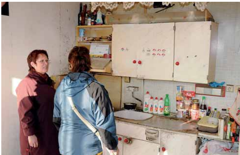
Jak vypadají byty po exekučním vystěhování, není třeba komentovat.

V průběhu října došlo v Chomutově k letošnímu pátému exekučnímu vystěhování z bytu z důvodu neplacení nájemného a služeb spojených s bydlením. Z pochopitelných důvodů není možné uveřejňovat jména exekvovaných osob ani další podrobnosti. Jisté je, že s dlouhodobým a palčivým problémem města Chomutova se něco pomalu začíná dít. Začíná se tak blýskat na lepší časy? Snad. Jsou a budou tak všechny problémy s bydlením ve městě vyřešeny? Ještě zdaleka ne. Je to běh na dlouhou trať. A je důležité, aby byl odstartován správným směrem.