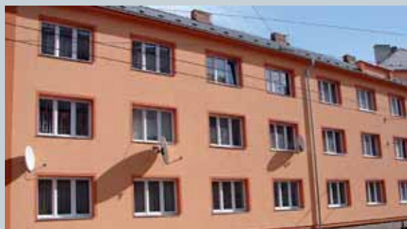
Nová okna a zateplené fasády v Palackého ulici

nájemníků, kteří dlouhodobě neplnili své povinnosti. Nevýběr nájemného ze 1700 bytů od 1. ledna 2009, kdy společnost funguje, se pohybuje v řádu milionů korun. Je relativní mluvit o tom, zda jde o částku vysokou, anebo nízkou. Možná lze víc naznačit procentuálním vyjádřením. Průměrný výběr v Chomutově se nyní pohybuje na necelých 6,5 procent prostředků, které lidé nezaplatili. Celostátní průměr se pohybuje okolo dvojnásobné částky. A nemá smysl zastírat, že v souvislosti