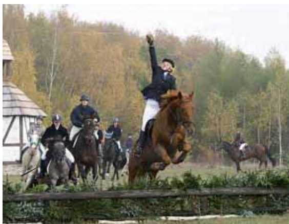
Tak vypadalo závěrečné halali při loňském ročníku tradiční Hubertovy jízdy.

Podkrušnohorský zoopark Chomutov, Jezdecký klub PZOO a Statutární město Chomutov pořádají 24. 10. 2009 tradiční