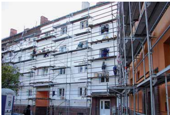
Práce na zateplení a výměnách oken v bloku domů Starý dvůr.

nájemníka z bytu exekutorem za přispění policie, strážníků městské policie a pracovníků domovní správy. V současnosti je podáno i dalších sedm návrhů k exekučnímu vyklizení bytu, kdy čekáme na souhlas s realizací. Ty akce probíhají samozřejmě pod dohledem pověřeného exekutora, popřípadě soudního vykonavatele Okresního soudu v Chomutově. V posledních měsících dosahujeme mnohem vyšší účinnosti v řešení problematiky neplátců nájmu i tím, že pracovníci Chomutovské bytové, a. s., podstatně zintenzivnili činnost. A funguje to a lidé si to mezi sebou řeknou.