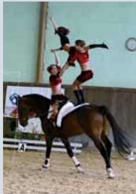
Vítězná voltižní juniorská skupina JK PZOO

V areálu Zemské-hřebčince v Tlumačově se na konci září konalo Mistrovství České republiky ve voltiži. Z Chomutova se na tento největší domácí závod vypravena kompletní ekvipáž složená z juniorské skupiny, dvou žen-junierek a jedné ženy-seniorky. Cílem bylo dosáhnout medaile v každé kategorii a velkým přáním dovzít poprvé v historii mistrovský titul v kategorii skupin.