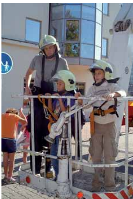
Malí návštěvníci Happy day si mohli vyzkoušet jízdu na vysokozdvizné plošině chomutovských hasičů.

Velkou pozornost dětí přitahovala hasičská technika. Odvážlivci se mohli s lesklou hasič-