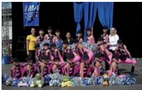
Kadetky 1. místo pom-poms