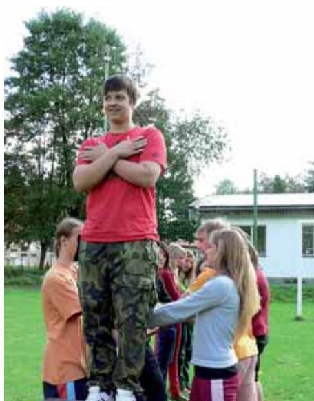
Chytí mě? A můžu jim věřit?