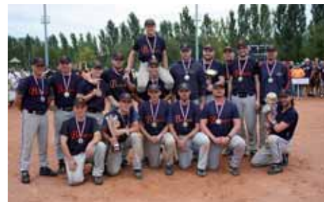
Mistrovský tým SC 80 BEAVERS Chomutov – vítěz Poháru mistrů evropských zemí 2009 v Itálii se zlatými medailemi a pohárem pro nejlepší mužstvo evropského turnaje.

Ve finále se odehrával taktický boj dvou vyspělých