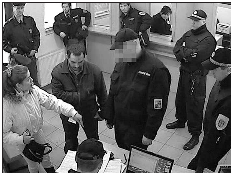
Dlužníci města byli exekucemi velice překvapeni.

Město vytrvá v exekucích. „Je to jediný způsob, jak zabránit tomu, že se někteří lidé vysmívají pokutám a dalším svým závazkům. Jejich pocit nedotknutelnosti byl takový, že házeli pokutové bloky k nohám strážníků,“ řekla primátorka. (tb)