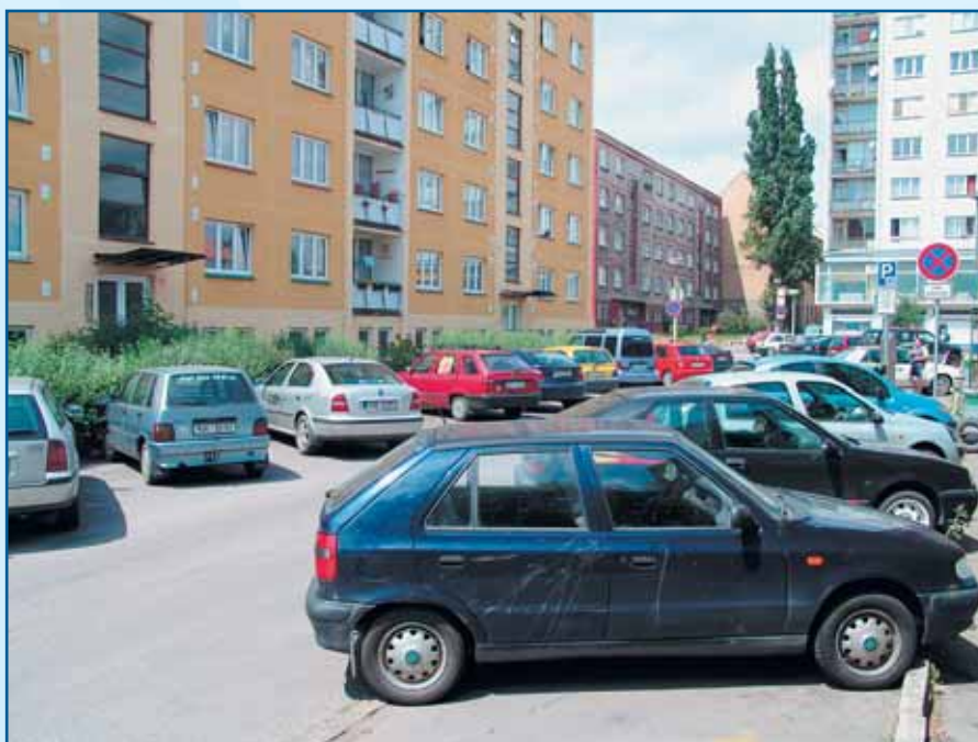
Z hlediska parkování patří k přetíženým lokalitám Palackého ulice.

Pracovní skupina zasedá každý týden a za tu dobu, včetně podnětů ze setkání s občany, řešila devadesát připomínek. Nejvíce dotazů, třicet devět, bylo na vysvětlení samotného systému parkování. Z toho šest mělo připomínky k cenám a šest bylo od invalidů. Třiatřicet podně-