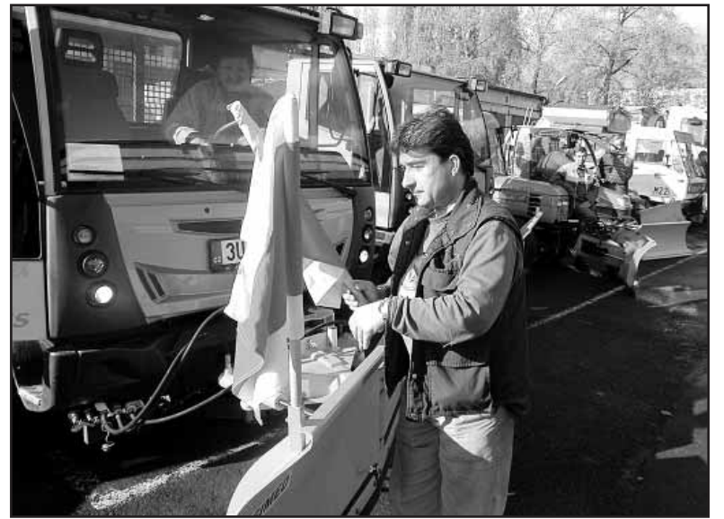
Pracovníci TSmCH při poslední přípravě strojů na zimní údržbu.