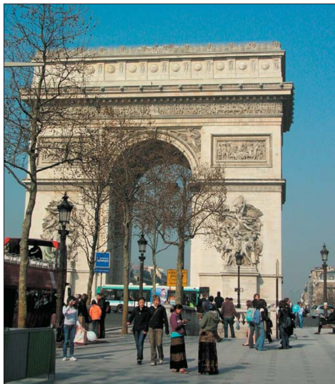
Mezi charakteristické symboly Paříže patří Vítězný oblouk na hlavní pařížské třídě Champs Elyseés.

Muchy po Nezvala, aby tu nacházeli inspiraci pro vlastní tvorbu. Člověk tu má totiž dojem, že by snad dokázal sám něco napsat nebo namalovat. Jasně, že to asi jen tak nejde, ale ta lehkost, s jakou Paříž vydechuje své zvláštní kouzlo, své vůně a barvy, ta dává každému pocit tvůrčí síly. Jsem vážně ráda, že jsme se i s pomocí města Chomutov mohli za poznáním do Paříže vypravit. (ŠŠ)