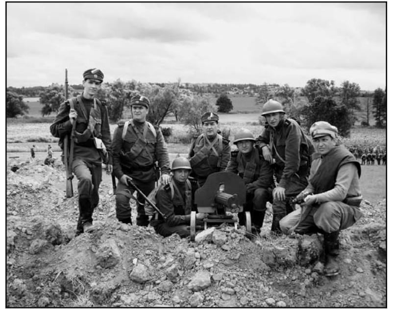
Jádro KPV Armus coby kulometné družstvo československých legií při letošní rekonstrukci bitvy u Zborova.

O tom, že je vojenská historie koníčkem časově náročným, není třeba pochybovat. Stejně jako o faktu, že manželky a partnerky z něj zrovna nadšené nejsou. Tolerovat musejí i finanční náročnost zájmu svých poloviček. „Snažíme se co nejvíc přiblížit tehdy platným výstrojním řá-