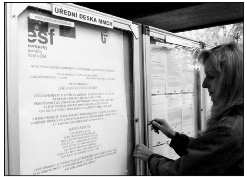
O projektu magistrát informoval veřejnost i prostřednictvím úřední desky.

„Semináře byly jejich účastníky hodnoceny kladně a zaměstnanci