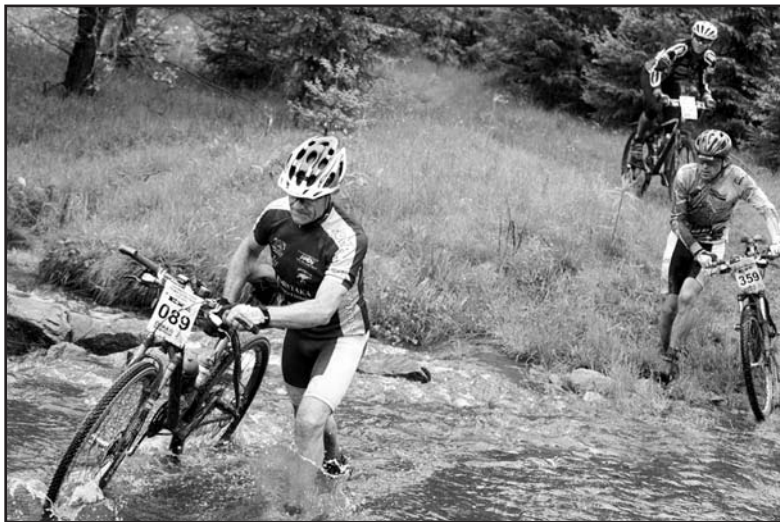
Přirozenou překážku na trase tvořily dva brody.