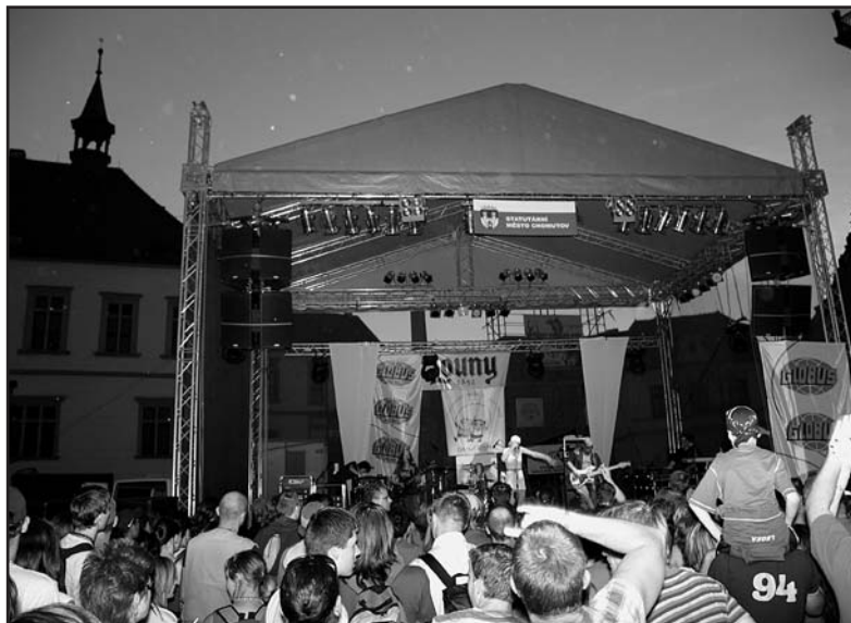
Při vystoupeních skupin Gaia Mesiah (na snímku) a Wohnout bylo na náměstí 1. máje plno.

Hudebním tahákům na náměstí přihlíželo přes tisíc osob, ale své publikum si našla i všechna další vystoupení. Ve švech praskalo šapitó při představeních Teatra Novogo Fronta a Divadla Continuo, stejně jako Kulisárna při produkci skupiny Mňága a Žďorp. Někteří diváci spatřovali vrchol festivalu i v dalších číslech - ve