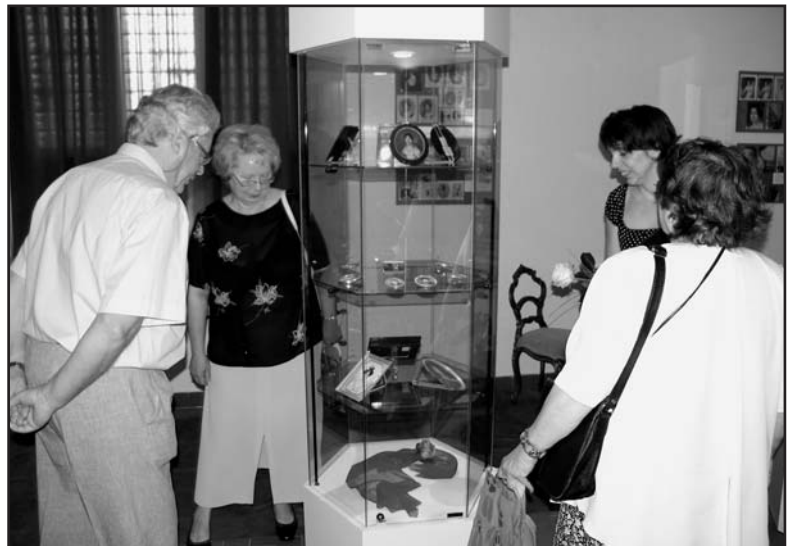
Vernisáž výstavy se setkala se zaslouženým zájmem veřejnosti.

Sbírka obsahuje i několik kuriozit. Za největší je považována slonovinová, stříbrem zdobená tabatěrka. Ta po otevření obsahuje nejen portrét právoplatné manželky vlastníka, ale po odklopení falešného dna ještě i utajené podobenko samotného majitele a jeho krásné milénky. Oblastní muzeum za podpory města Chomutova vyda-