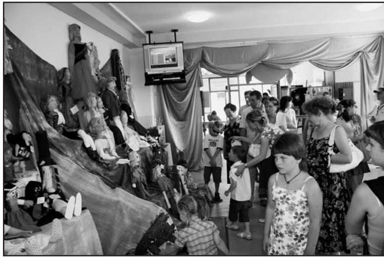
Na vernisáž výstavy a udělení cen přišlo 450 návštěvníků.

Základní škola v ulici Akademika Heyrovského může být pyšná na další projekt, do kterého se jí podařilo zapojit školáky a předškoláky z celé republiky. Školní časopis Felix vyhlásil loni na začátku školního roku výtvarnou soutěž s názvem Kouzelný svět loutek a nyní, na jeho konci, pořádá ze zaslávaných prací výstavu.