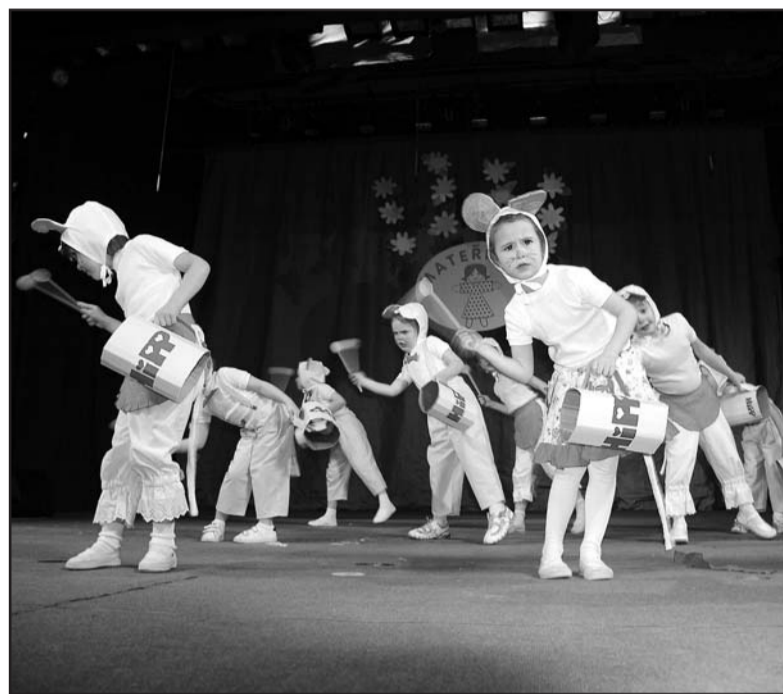
Mezi přespolními vystupujícími byly také Myšičky z jirkovské mateřské školy v Bezručově ulici.