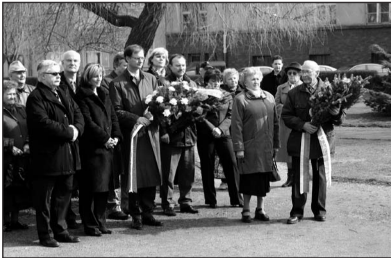
Od narození prvního prezidenta Československa Tomáše Garrigue Masaryka uplynulo 7. března 157 let. Položením květin u jeho pomníku si památku významného státníka připomněli představitelé města a společenských organizací, jejichž činnost vychází především právě z Masarykova odkazu. (lm)

Město obyvatele panelových domů v Beethovenově ulici oslovilo anketou. Po jejím vyhodnocení bude následovat další dialog s nájemníky a poté bude zvolen další postup, vycházející z názoru většiny. (lm)