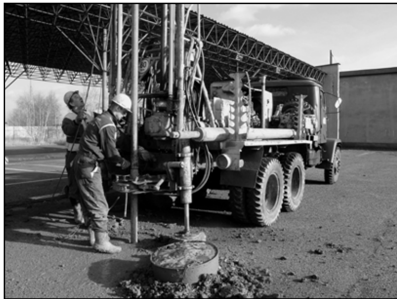
Vrtnou soupravu obsluhují Miroslav Kubů a Ondřej Potančo.

Nový zimní stadion by měl být podle současných plánů hotov do konce roku 2008. Celá stavba, jak je patrné z obrázku, bude v konečné fázi sestávat ze tří bloků - vlastního stadionu s hledištěm pro pět tisíc diváků, šatnovacího bloku a tréninkové ledové plochy. Stávající zimní stadion bude zbourán až poté, co bude zprovozněn nový. Na uvolněné ploše vyroste obchodní dům společnosti Spar. (sk)