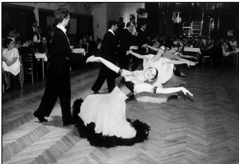
Formace Sportovního tanečního klubu.

doby ve městě působí dvě špičkové taneční školy. To Chomutov pasuje do role mečky tančování, což také symbolizuje socha tanečnice před městským divadlem.