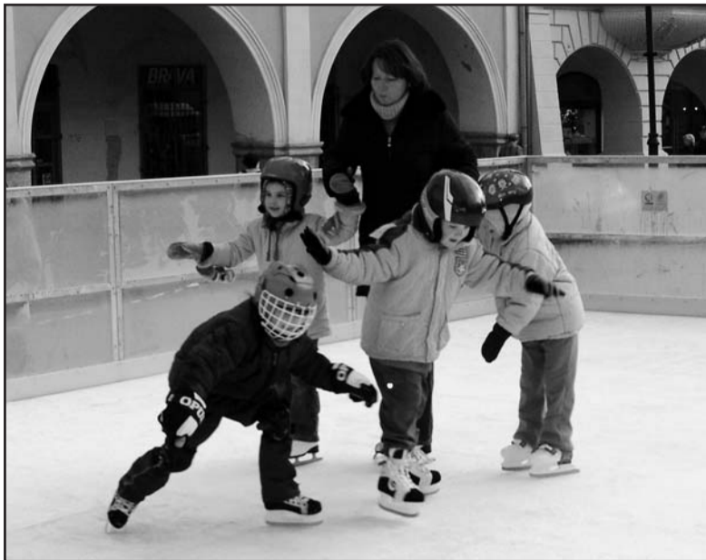
Umělý led na náměstí 1. máje se líbil hlavně dětem.

S velkou odevzou se setkal i kupon v Chomutovských novinách, který pro bruslení na zimním stadionu využil 580 čtenářů. Také díky tomu eviduje Správa sportovních zařízení Chomutov nejvyšší prosincovou návštěvnost