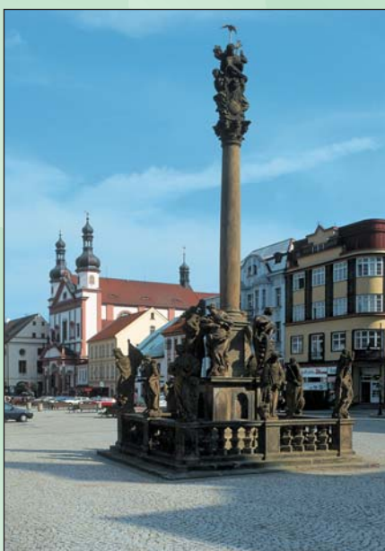
Barokní sloup Nejsvětější Trojice