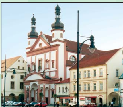
Kostel sv. Ignáce