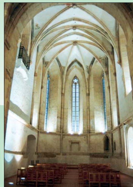
Kostel sv. Kateřiny