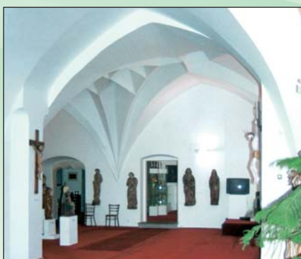
Oblastní muzeum - budova radnice