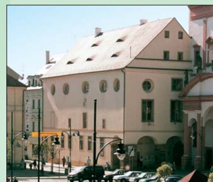
Objekt galerie Špejchar