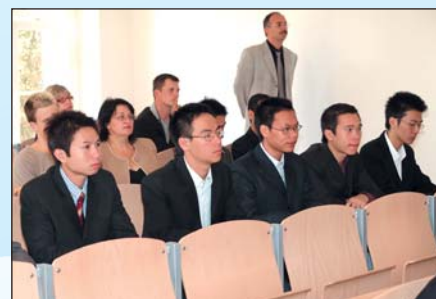
Zahájení výuky se zúčastnili i vietnamští studenti.

čal; připomínka osobnosti zakladatele ČVUT při té příležitosti tak symbolicky překlenula oblouk mezi minulostí a současností. (lm)