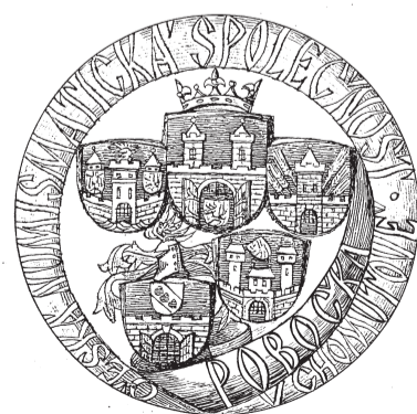
Znak pobočky, který je i na pamětní medailli vydané k 25. výročí jejího založení.