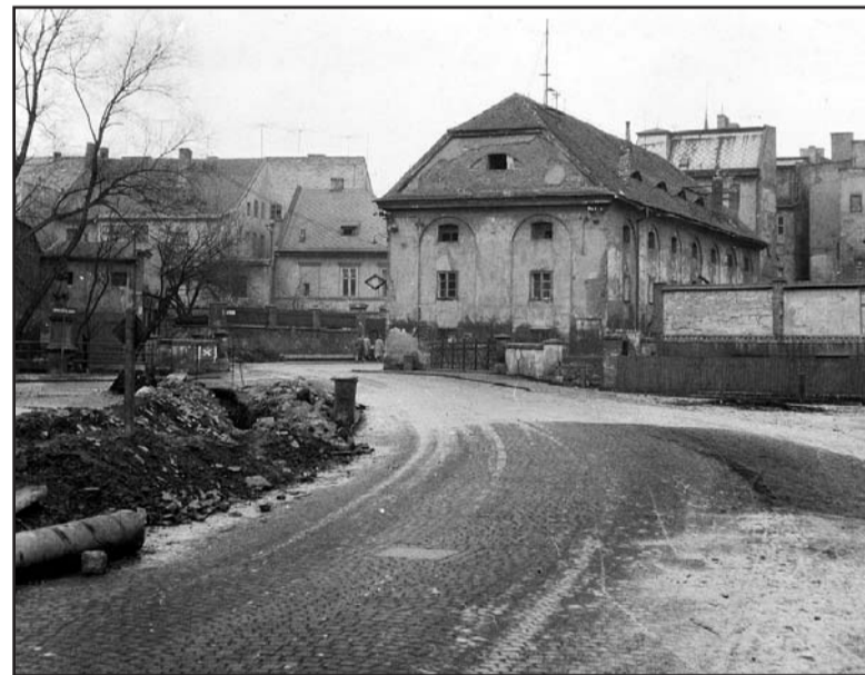
Červený mlýn byl oproti pozdějšímu třípodlažnímu paneláku vysunut více do ulice, stával přímo u silnice, v místech, kde je dnes zastávka MHD.

Na místě panelového domu číslo popisné 5379 stávala rozlehlá budova mlýna. Po roce 1945 byl objekt nazýván Červený mlýn. Původní název býval ale Kuttelhof nebo Kuttelmühl. První mlýn v této části špitálního neboli Pražského předměstí vznikl již ve středověku. Z jezuitského areálu vycházel hlavní mlýnský náhon, který prošel pod Riegrovou ulicí do dvora mlýna a za ním u jezu ústil do Chomutovky. Za jezem náhon přecházel na pravý břeh Chomutovky. Poslední zbytky náhonu zmizely při opravách nábřežních zdí. Na chomutovském náhonu byly postaveny nejen mlýny, ale i hamry, drtírny, pily, rourárny (vrtání vodo- vodních rour do kmenů stromů), lisovny oleje. Dvorní prostory za objekty v Hálkově ulici jsou dnes zaplněny změtí skladových hal, kůlen a garáží. Než zde vznikla tato provizorní zástavba, býval tu velký dvůr starého městského špitálu za kostelem svatého Ducha a dvůr areálu mlýna. Do šedesátých let 20. století byla zbořena stavba špitálu, jehož