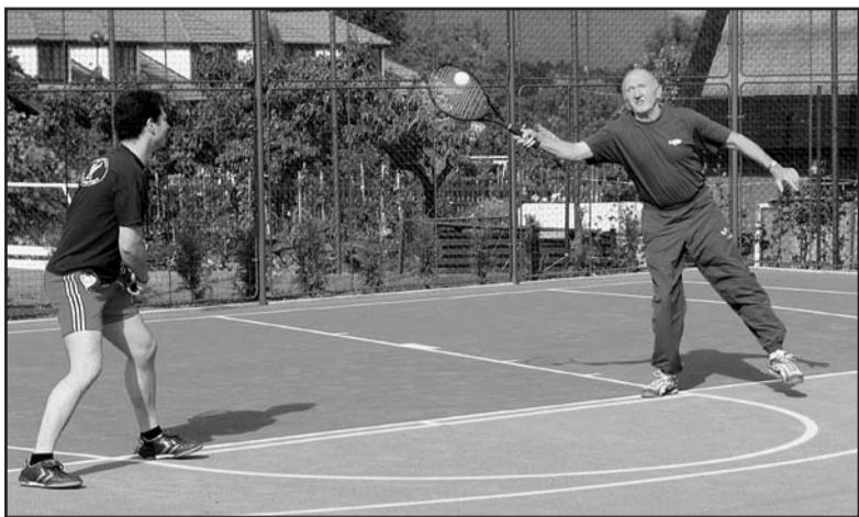
Zástupci Annabergu-Buchholze při tenise v rámci trojboje.

Nyní už je celý areál plně k dispozici veřejnosti, a to nejen obyvatelům města, ale díky propojení s prostorem Kamencového jezera také rekreativům. Provoz ovšem nebude celoroční, ale počítá se s ním zhruba od začátku dubna do konce října. V tomto období bude na areál dohlížet správce, který bude současně vyřizovat pronájmy jednotlivých ploch i půjčovat sportovní náčiní. Například hodinová sazba na pronájem nového velkého hřiště je ve všední den do 15. hodiny 120 Kč, po ní o 20 Kč víc, streetballové hřiště ve stejné době stojí 80, respektive 100 Kč. Za půjčení tenisové rakety se platí 30 Kč, basketbalové míče jsou k dispozici zdarma, platí se jen záloha. Někteří sportovci už nyní nabízených služeb využívají. „Současné počasí i předpověď na další dny jsou příznivé, ale protože veřejnost o novém sportovišti moc neví, není zatím patřičně vytiženo. Věřím, že postupně si sem najde cestu daleko víc příznivců pohybu,“ vyjádřila přesvědčení Jitka Fischerová.