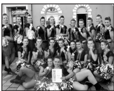
Jedna z úspěšných seniorských formací s medailemi.

Chomutovská družstva závodila ve všech věkových kategoriích v disciplíně pom-poms (trásně), což je soutěž v pochodovém dešifru a pódiová formace, a také v disciplíně baton, kde soutěžila formace juniorská. Celkem se mažoretkám z TŠ Stardance podařilo získat