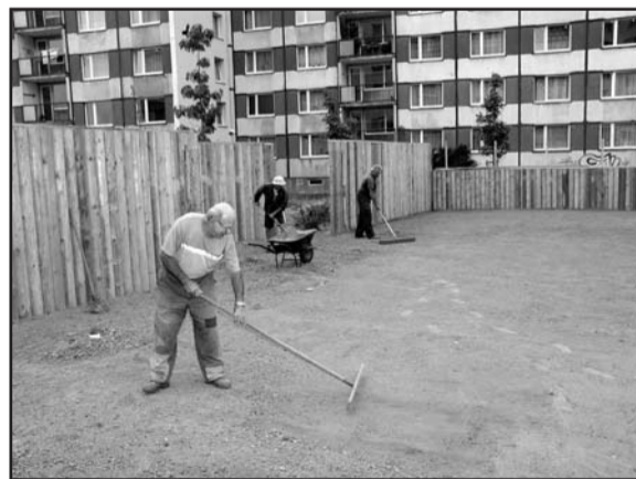
Na snímku vlevo Zdeněk Kostka, Josef Jireš a Robert Grubl (odpředu dozadu) při zarovnávaní terénu, přípravě před setím trávy. Na snímku vpravo hřiště pro malé děti, které se hned po otevření setkal se zájmem předškoláků z okolí.